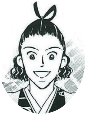
ひらがげんない 平賀源内