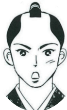
とくがわいえはる 徳川家治