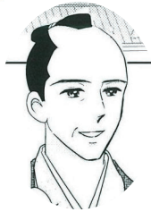
たぬまおきゆき 田沼意行