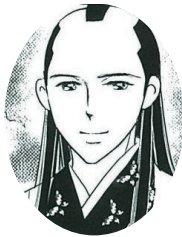
とくがわいえしげ 徳川家重