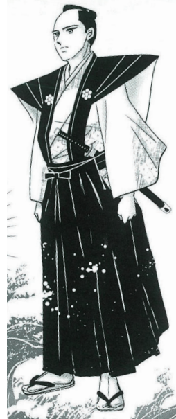
たぬまおきつぐ 田沼意次