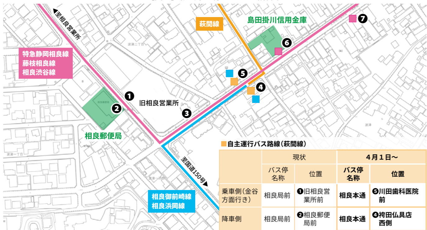
【図2】相良本通付近のバス路線図

このタクシーは、予約をした会員登録者の自宅と特定施設（病院や公共施設、スーパーなど）の間を、乗り合わせながら定額料金で移動できるものです（運行時間は固定）。事前の会員登録（無料）が必要となりますので、利用を希望する人は会員登録申請書の提出をお願いします。