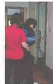
トイレの自立を 目指して