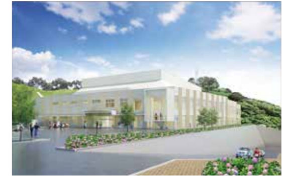
事業者提案の外観パース図 (今後の設計により変更する場合があります)

牧之原市多目的体育館整備事業について、公募型プロポーザルにより事業者が決定しました。この多目的体育館は、災害時には「市の防災拠点」、普段は「誰もが使いやすいスポーツ施設」として利用できるよう、令和5年度末の供用開始を目指して、整備を進めていきます。 問い合わせ スポーツ推進課 ☎032643