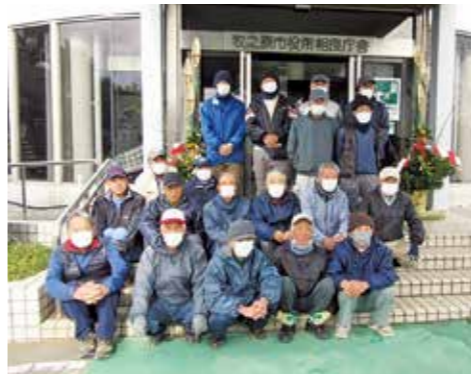
市役所庁舎に門松寄贈

詳しいセンターの情報や仕事の内容は、ホームページをご覧ください。「牧之原市シルバー人材センター」で検索できます。