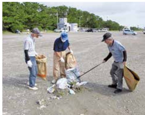
奉仕活動（相良海岸）

「入会条件」 60歳以上で、センターの趣旨に賛同する人 「主な仕事内容」 家事援助、施設の補助作業（洗濯、掃除、受付、管理）、運搬業務、事業所・工場などの軽作業、除草、空き家・空地管理など 「入会などの問い合わせ」 牧之原市シルバー人材センター 富田 ☎(52) 5080 HP http://webc.sjc.ne.jp/makinohara/index