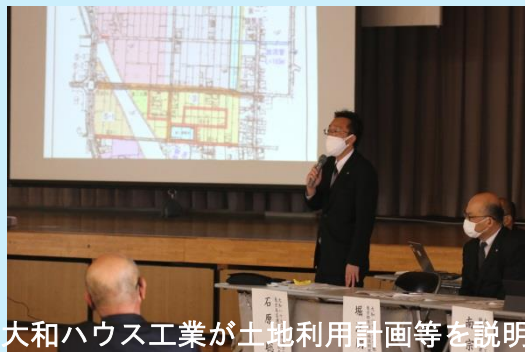
大和ハウス工業が土地利用計画等を説明