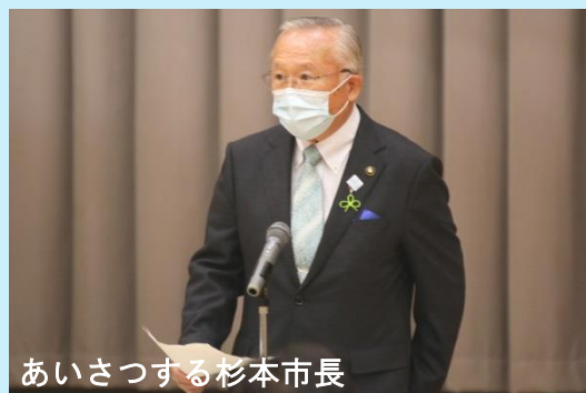
あいさつする杉本市長