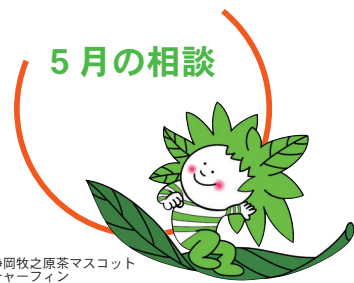
静岡牧之原茶マスコット チャーフイン

新型コロナウイルス感染症対策のため、マスクの着用と体温測定の実施にご理解、ご協力をお願いします。お出かけ前に、ご自宅で体温を測定し、37.5℃以上ある場合のほか、咳症状や倦怠感などがある場合は、相談を見合わせてください。相談会場でも体温測定を行い、37.5℃以上ある場合や咳症状がある場合などは、電話相談への切り替えや相談の延期などをさせていただく場合があります。