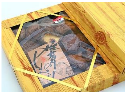
椎茸大どんこ箱詰