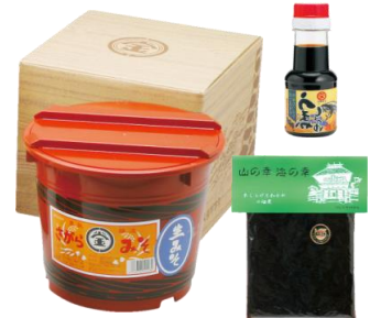
さがら味噌セット