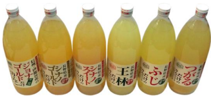
信州産リンゴジュース(6本)