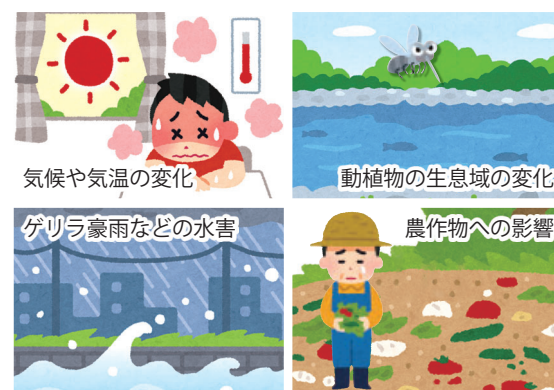
気候や気温の変化

近年、世界各地で記録的な熱波や大規模な森林火災、ハリケーンや洪水などが、未曾有の被害をもたらしています。国内でも、災害級の猛暑や熱中症による搬送者・死亡者の増加のほか、台風・豪雨の被害が毎年のように発生しています。このような気候変動の原因の一つとして、地球温暖化が挙げられています。 さらに、IPCCは、今のままの温暖化対策では、80年後の平均気温が最大4・8度上昇すると予測しています。気温が上昇するにつれ、異常気象や海面の上昇、生態系への影響、感染症の拡大、農作物への影響がさらに大きくなる懸念があります。