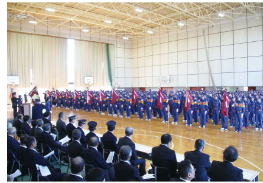
出初め式式典(前年の様子)

Q 消防団はどんなことをするの? A 消火活動、風水害警備、花火大会警備、防災訓練などの地域活動のほか、さまざまな行事に参加します。 Q 消防団に入るためには? A 牧之原市内に居住、勤務、在学する人で、年齢が18歳以上なら、誰でも消防団に入ることができます。