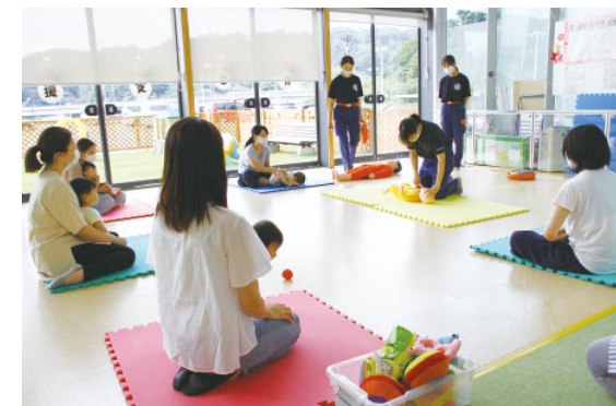
子育て支援センターでの救命講習