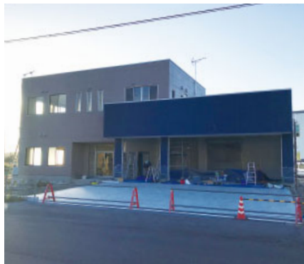
建設中の地頭方消防館

平成29年3月12日に新たに施行された「普通免許」と「中型免許」の間に当たる新しい運転免許の種類。この免許を取得することで、車両総重量7.5トン未満、最大積載量4.5トン未満の車両を運転することができます。