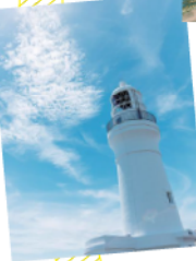
日本の灯台の姿にも選出。展望デッキからは雄大な海が広がる。

☎0548-63-2550(観光会館御前崎支所) 📍御前崎市御前崎1581 ☎灯台内見学9:00~16:00(2020年10月末までの土・日曜、祝日は~16:30) 🚫無休 🚗灯台内見学料大人300円 🚗92台