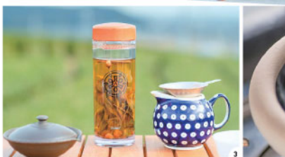
1.茶畑の向こうに駿河湾や富士山も見える 2.オプションでは釜炒り茶作り体験も 3.香り豊かですっきり飲みやすい「釜炒り茶」

☎054-251-5937(すぎ金指販売所) ☎牧之原市静波2695 ☎10:00~18:00で4番制、体験時間90分、3日前までHPから予約制(HPは茶事室) 🚫不定期、雨天時 ☎1,300円(お茶セット付) 🚗2台