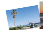
南国ムード漂う穏やかなビーチ。秋田の出スポットとしても人気

☎0548-63-2623(牧之原市観光局) 📍牧之原市相良500台(夏期有料)