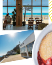
御前崎ベリー&ベリーパンケーキ980円

☎0548-63-1100 📍御前崎市御前崎1565-2 ☎11:00~17:00(L.D.) 🚫水曜 🚗店舗前に市営駐車場あり