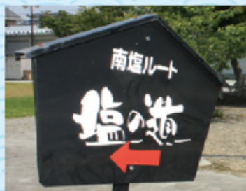
塩の道に設置されているルート看板