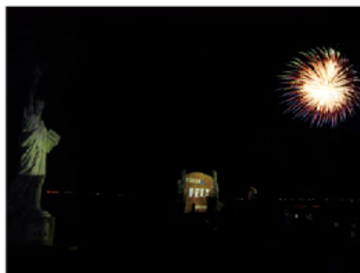
宿泊客を歓迎し、感染症の終息を願い打ち上げられた花火(静波海岸)

今回の花火の打上場所の情報は、新型コロナウイルス感染症対策のため、無料通信アプリ「LINE」の市公式アカウントとメールマガジン「まきはらTeaメール」の登録者に限定して提供されました。各会場では、午後8時から5分程度にわたり、おもてなしと新型コロナウイルス早期終息の思いが込められた花火20発が打ち上がり、夜空を彩りました。