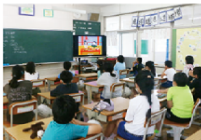
映像を見ながらスマホなどの安全な使い方を学ぶ児童

授業を受けた児童は「スマホについて理解できた。決めた時間は守ろうと思う」と話しました。