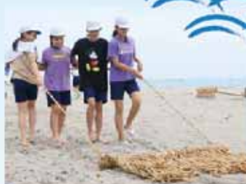
「モッコウ」を使って砂浜をならしていく児童