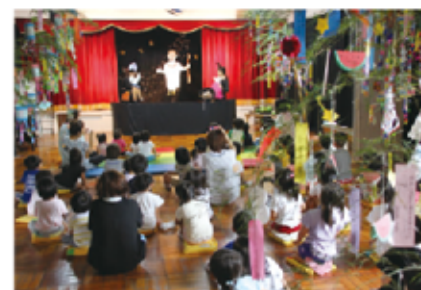
織り姫と彦星、神様の寸劇で七夕について学ぶ園児ら