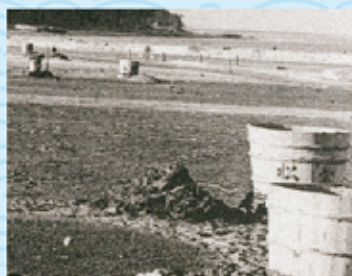
掘浜式の塩づくりが行われていた頃の様子

当時、作られた塩は、相良地域を起点とする総延長200キロメートルに及ぶ「塩の道(信州街道)」を通り、海のない信州地方(長野県塩尻市)まで運ばれていました。 現在でも市内には、「塩の道」の道標や常夜燈が残されており、ウォーキングやサイクリングコースとして親しまれています。