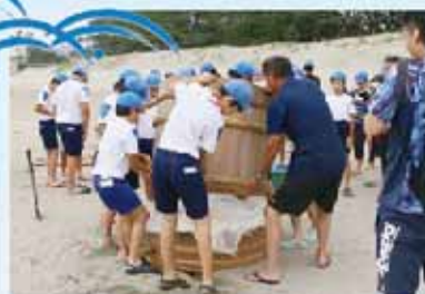
みんなで協力しながら塩づくりの準備をする児童ら

体験 を終えた児童たちは、楽しみながらも、身近な海から塩を作ることで、改めて自然の恵みに感謝していました。