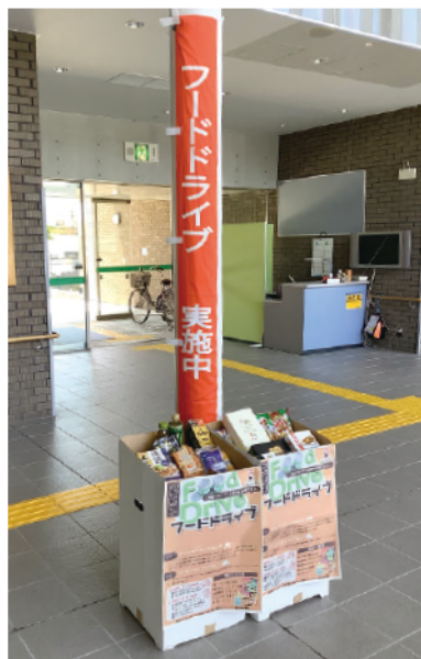
さざんかに設置されたBOX(以前の様子)

令和元年10月に「食品ロスの削減の推進に関する法律(食品ロス削減推進法)」が施行されました。それに伴い、市でもフードバンク活動の支援を積極的に実施しています。