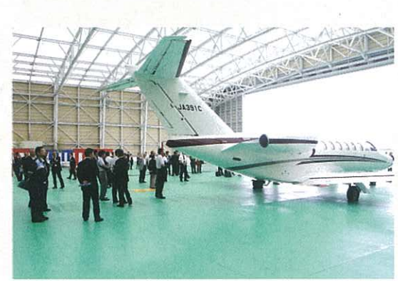
富士山静岡空港格納庫が完成