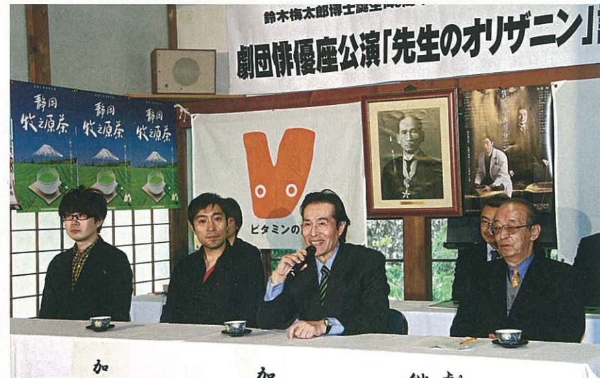
鈴木梅太郎博士生誕140周年記念舞台「先生のオリザニン」製作発表