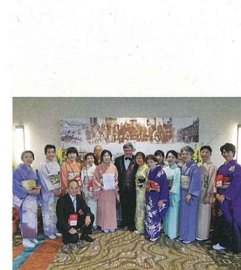
花の会が国際コンクールで最高評価を受賞