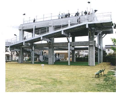
市内で第1号の津波避難タワーが完成