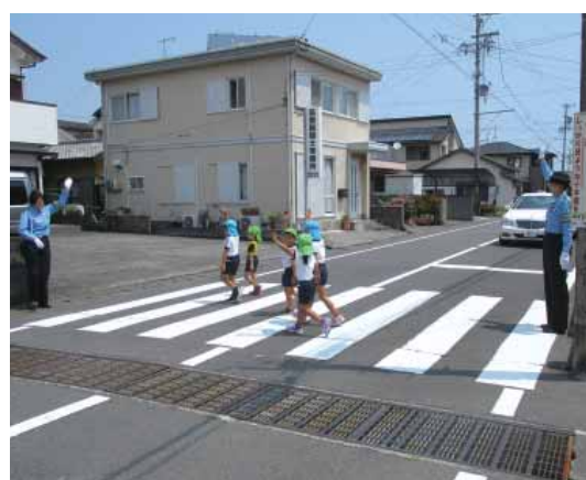
県交通安全協会指導員と一緒に散歩コースを歩いて点検

相良こども園では、県交通安全協会指導員や市建設管理課の担当者が、保育士や園児ら約30人と一緒に散歩コースを歩きました。見通しの悪い交差点や歩道が狭くなっている場所、舗装がはがれて歩きにくい箇所など危険な場所を確認し、園児にも注意を呼び掛けていました。今回見つけた危険箇所については、関係機関と連携しながら、改善を図っていきます。