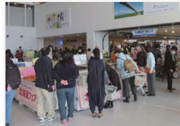
にぎわうターミナルビル内