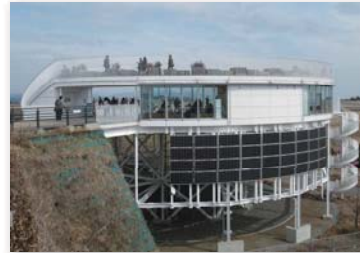
石雲院展望デッキ