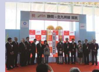
静岡ー北九州線就航記念式典

北九州空港は、福岡県北九州市にある海上空港です。福岡市から車で約1時間、本州の山口県山口市から車で約1時間20分の場所に位置しているため、九州地方だけでなく、中国・四国地方への旅行にも便利です。また、北九州市は産業都市であり、多くの企業の工場が立地しています。平成30年には「工場夜景ブーム」の影響や光演出の豊富さなどが評価され、長崎市、札幌市と並び「日本新三大夜景都市」として認定されました。他にも、門司港レトロ、小倉城などの観光名所や、焼きカレー、焼きうどんなどのグルメが有名です。