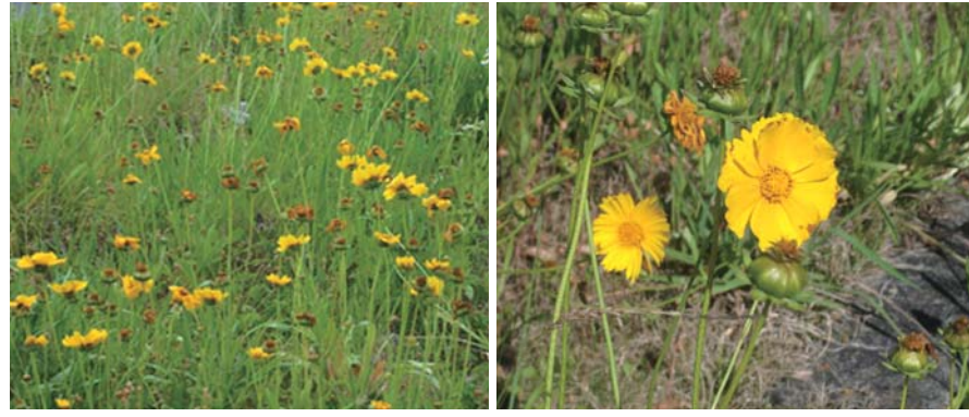
特定外来種に指定されているオオキンケイギク

特定外来種「オオキンケイギク」 5月から7月にかけて、主に道路のわきや空き地などに黄色の花を咲かせるのが、外来種であるオオキンケイギクです。 以前は、景観や緑化を目的に、道路の緑地帯などに植えられていたものの、繁殖力が強く、周りの在来種の生育場所を奪ってしまうため、平成18年2月1日に特定外来種に指定されました。 自宅などに生えているのを見つけたときは、次の方法により駆除するよう協力をお願いします。 ▼8月以降11種が飛びやすく拡散する時期 8月以降は種が飛びやすい拡散しやすい時期となるため、前述の方法による駆除は行わない