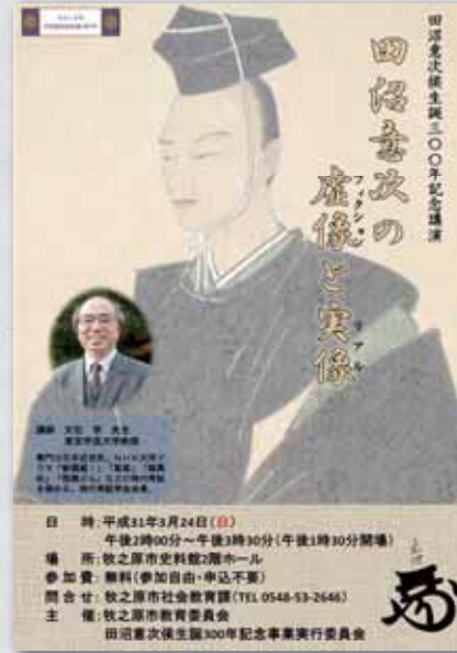
*当初お知らせしていた演題から変更されています。