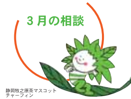
静岡県立原茶マスコットキャラクター

秘密は厳守されますので、ひとりで解決しようとせず、まずは相談してみたいはかがですか。