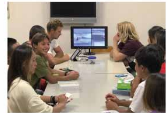
ビデオチェックによる練習の振り返り