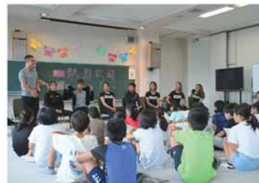
相良小学校の児童と交流