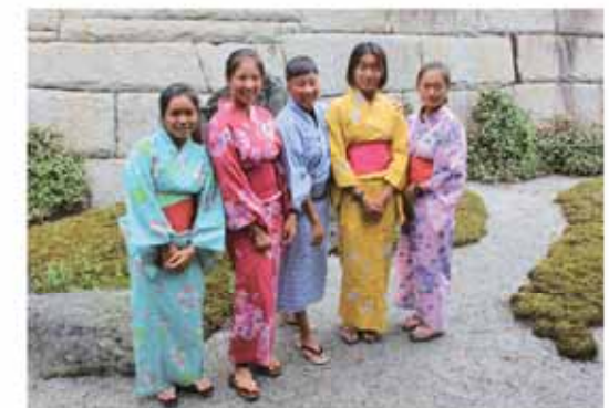
着付けや茶道などの日本文化を体験