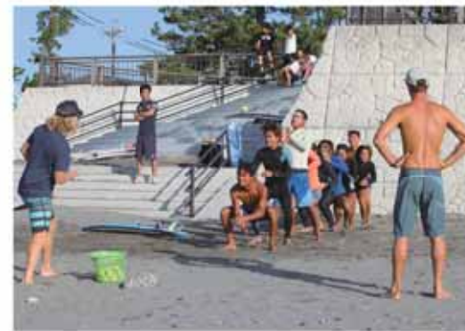
陸上トレーニングで基本動作を学ぶ

フィン競技が追加種目として決定したことにより結成されたナショナルチームで、本市での合宿が初めての海外合宿となりました。 滞在中は、早朝から静波海岸や須木海岸などでトレーニングに励んだほか、日本文化体験や小学校の授業への参加など、市民との交流を図りました。 チームは合宿後、9月15日から愛知県田原市で開催される「ワールドサーフィンゲームズ」に出場します。選手の多くは10代で、今後の活躍が期待されます。