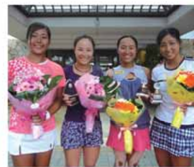
2017年大会に出場した選手たち

本大会は今年で26回目を迎え、これまでに、今年のウィンブルドンで優勝したケーパー選手(ドイツ)がジュニア時代に出場し、今年初の全仏ダブルス準優勝の穂積・二宮組は5年前に優勝しています。今年も世界中から多くの選手たちが集まっています。自由に観戦できますので、ぜひ会場に足を運んでみてください。