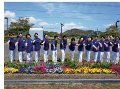
奨学金制度を活用して、一緒に働きましょう!

榛原総合病院には、将来、看護師を目指している皆さんが、専門学校や大学で勉学に専念するための「奨学金制度」があります。榛原総合病院組合と、指定管理者である徳洲会(榛原総合病院)の両方の制度を併用すると、毎月10万円の奨学金を受け取ることが出来ます。気軽に相談してください。 *学校区分(大学・短期大学・専門学校)は問いません。 *下記条件に記載されている施設で、貸与期間と同じ期間、常勤看護師として従事した場合、返済が全額免除されます。