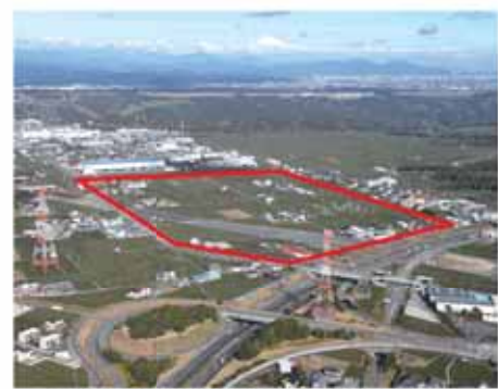
東名高速道路相良牧之原IC北側地区 (平成28年2月撮影)

郵送先 〒421-0592 牧 之原市相良275 牧之原市役所 都市計画課宛て 提出期間 8月31日(金)～9月14日 (金) *郵送の場合は、期間内の消 印有効 公述人の選定 公述申出者が多数 の場合は、抽選で決定します。公 述人に選定された場合は、本人に 通知します。