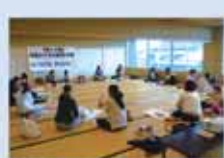
子育てを応援する講座