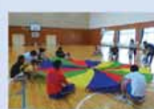
お父さんと遊ぼう