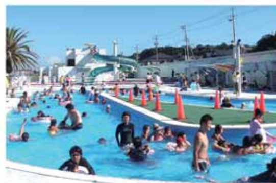
流れるプールやウォータースライダーを楽しもう

シーサイドプール地頭方は、市内唯一の市営屋外レクリエーションプールです。夏のレジャーや家族のふれあいの場として、ぜひ利用してください。 流れるプールやウォータースライダーでは、ちょっとしたスリルが味わえます。シーサイドプールで大人から子どもまでみんなで夏を楽しみましょう。 休憩時間には、恒例の「アヒルレース」が開催されます。