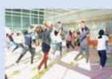
ちやちやっこベビー