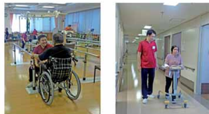
各スペシャリストが適切なサポートを行います

「回復期リハビリテーション病棟」でのリハビリを検討される場合は、まずは、現在治療を受けている医療機関の医師や医療ソ