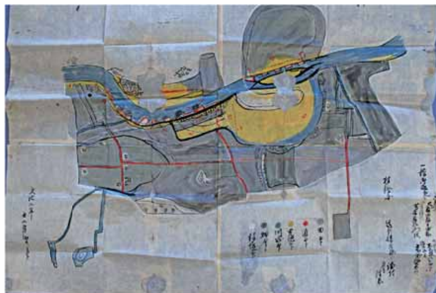
古地図・古絵図の例 - 徳村絵図(市史料館所蔵) -

地図をお持ちの人、家に古い文書のある人、お心当たりのある人などは、担当者に連絡をお願いします。