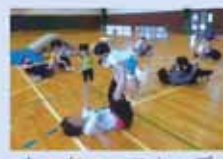
ちやちやっこキッズ

親子で楽しい行事に参加すると、友達との交流も深まります。また、子育ての情報交換もできます。