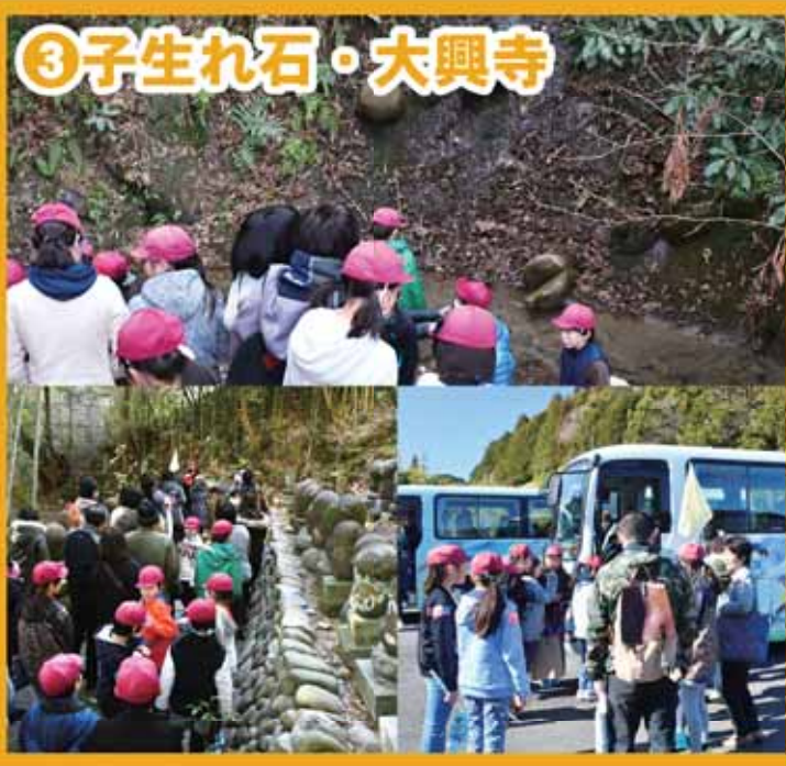
③子生れ石・大興寺