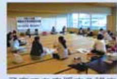
子育てを応援する講座

親子で楽しい行事に参加すると、友達との交流も深まります。また、子育ての情報交換もできます。 毎月、子育て支援センターだよ「ちゃちゃっこ広場」を発行し、行事を紹介。子育て支援センターや児童館、保健センター、市役所にあります。また、市のホームページやまきはくでも見られます。