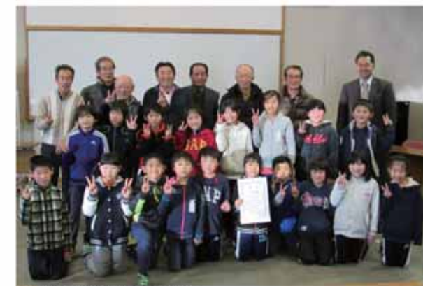
入賞を関係者みんなで喜ぶ