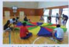
お父さんと遊ぼう