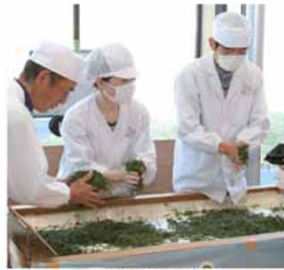
お茶の手揉み実演

牧之原市茶手揉保存会 手揉み技術を伝承しお茶の味を守る 問い合わせ お茶特産課 名波 ☎(53) 2621