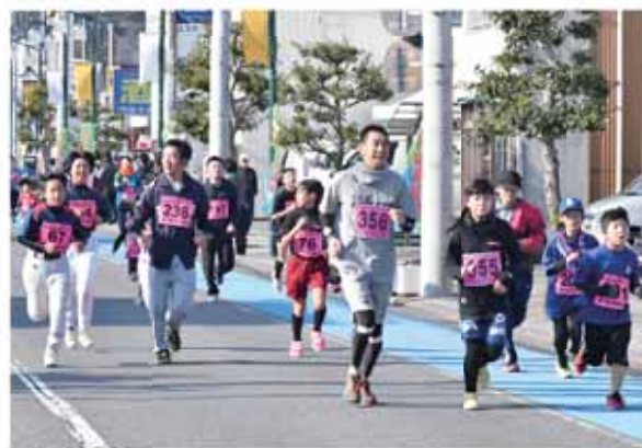
エンジョイコースを楽しみながら走るランナー

また、順位やタイムなど気にせず誰でも参加できるエンジョイコース（2キロ）も行われ、参加者は自分に適したコースで大会を楽しみました。