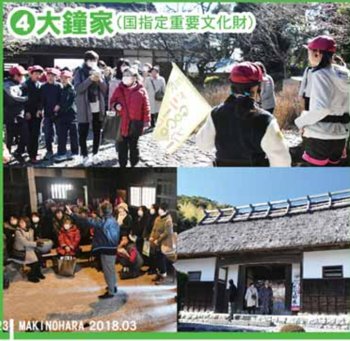
④大鐘家 (国指定重要文化財)