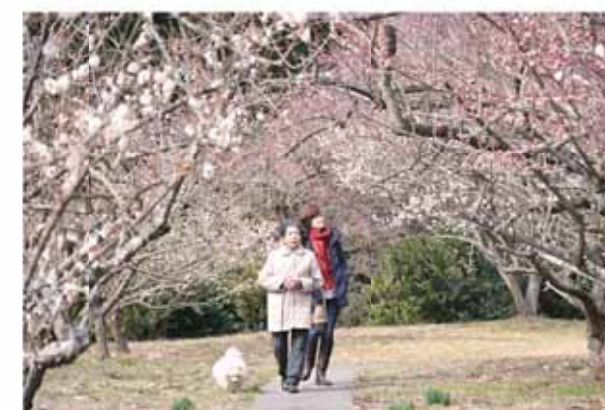
色鮮やかに染まった梅を楽しむ来場者

また同園では、地元産のとれたての大根や白菜など、多くの地場産品が販売されたほか、入園者にはお土産として、自家製の梅干しがプレゼントされました。