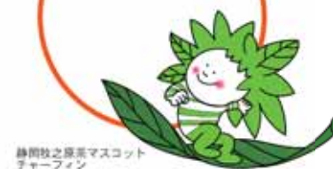
静岡牧之原市マスコット チャーフィン