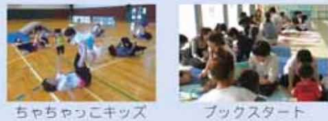
ちゃちゃっこキッズ

子育て支援センター(榛原相良) 子どもとゆったり過ごしたいとき、同年齢の子どもを持つ仲間が欲しいとき、子育てにちよつと疲れたときなどに、子どもと一緒に過ごしてください。 静岡県認定「子育て未来マイスター」「子育て支援員」の保育士