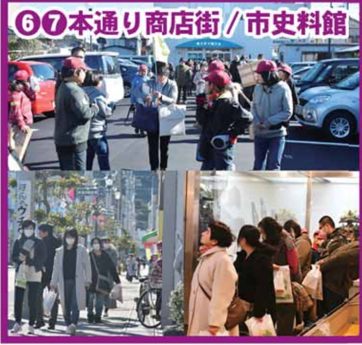
⑥⑦本通り商店街 / 市史料館