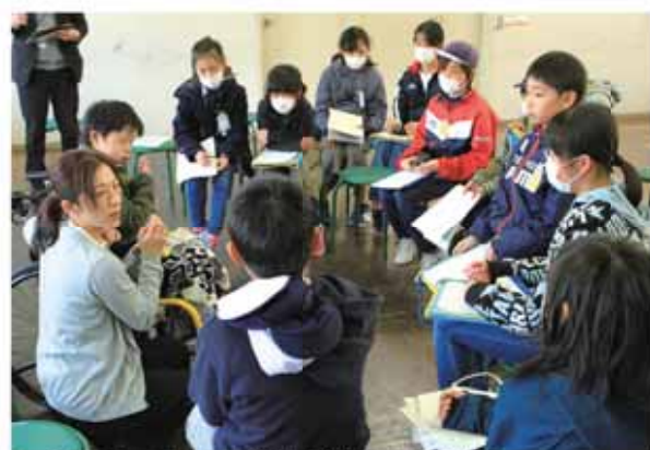
メイフラワーの家族と意見交換を行う児童たち

広報担当が取材に行きます。あなたの身近にあるホットで楽しい話題やイベントなどの情報をお待ちしています。 秘書広報課 ☎230052 ✉seisaku@city.makinohara.shizuoka.jp