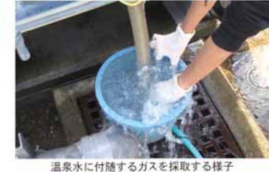
温泉水に付随するガスを採取する様子

子生れ温泉の温泉用掘削井から得られる付随ガスは、99.9立方メートル/日です。この温泉付随ガスには99%の高い割合でメタンガスが含まれており、現在も大気放散されている温泉付随ガスは十分に有効利用する価値があります。 例えば、温泉施設に25キロワットのガスエンジン発電機を1基導入した場合、1日あたり約10時間稼働させることができます。さらに、温泉付随ガスに含まれるメタンガスを燃料としてガスエンジン発電機を稼働させ、発電および熱回収を行い有効利用することで、年間約600トンの二酸化炭素の削減効果が見込まれます。