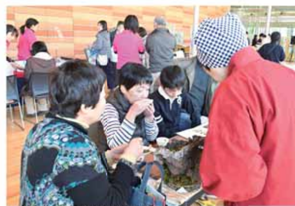
さまざまな種類のお茶を堪能する来場者