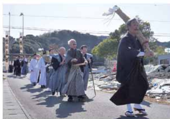
榊の葉を口にくわえて御神体を一幡神社へと運ぶ行列

この後、さいの目状にした御本飯を榊の葉に包んだ御神体「御榊様」が作られ、1年間神社にある御飯屋に祭り、翌年の豊作を願いました。