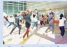
ちゃちゃっこベビー