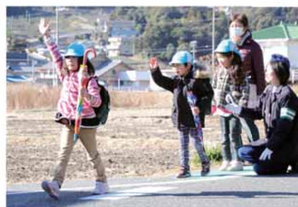
指導を受けながら小学校まで歩く園児

登下校の体験をした園児は「傘を差しながら歩くのは大変だったけど、小学校までしっかり安全に歩けた」と話しました。