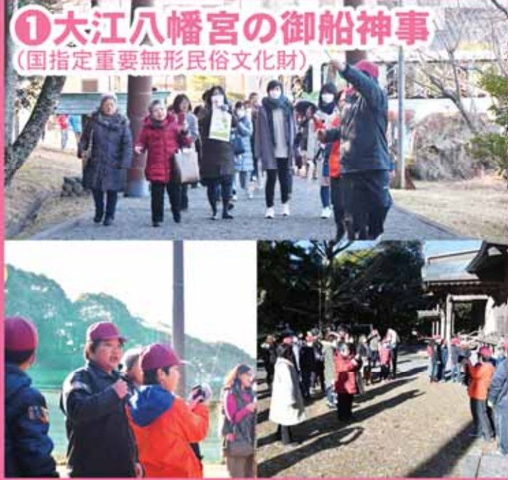
①大江八幡宮の御船神事 (国指定重要無形民俗文化財)