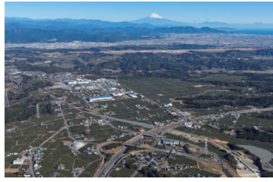
東名高速道路相良牧之原IC北側地区(平成30年1月撮影)

準備組合は、民間事業者の力を活用した土地画整理事業の推進を図るため、平成30年7月から、準備組合の委託を受けて事業の認可取得や組合設立に向けた業務を行う一括業務代行予定者の募集を開始しました。参加資格審査の実施後、期限までに応募者1社から事業提案書が提出されました。9月に準備組合役員、牧之原市長、市職員を審査員とする選定審査を開き、厳正な審査の結果、次の企業を一括業務代行予定者候補として決定しました。 〔一括業務代行予定者候補〕 大阪府大阪市北区梅田三丁目3番5号 大和ハウス工業株式会社