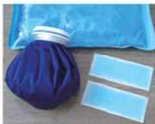
冷却ジェルシートや氷のうなど冷感グッズを活用