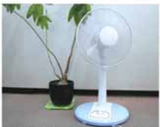
冷房に加えて扇風機を効果的に活用する