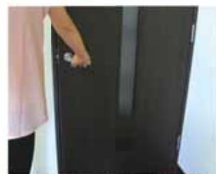
冷房使用時は冷やした空気を逃がさないようドアや窓を閉める