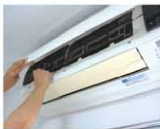
こまめなフィルター掃除でエアコンの効き目アップ