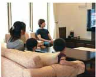
一つの部屋に集まり一家庭らエアコン稼働も一台