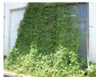
グリーンカーテンでお部屋を涼しい木陰に