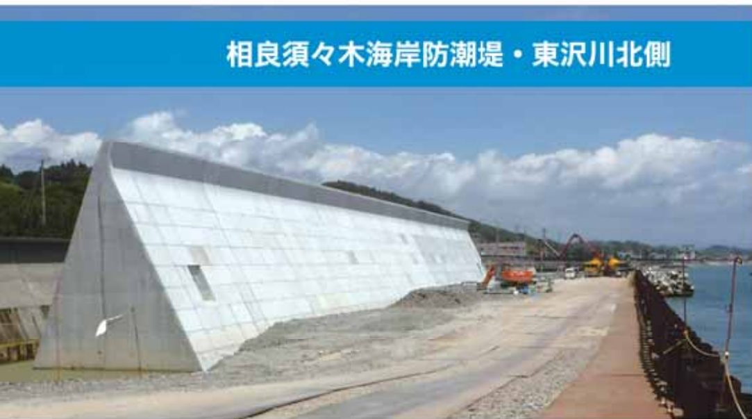
相良須々木海岸防潮堤・東沢川北側