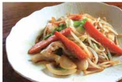
野菜炒め (居酒屋 つま恋)