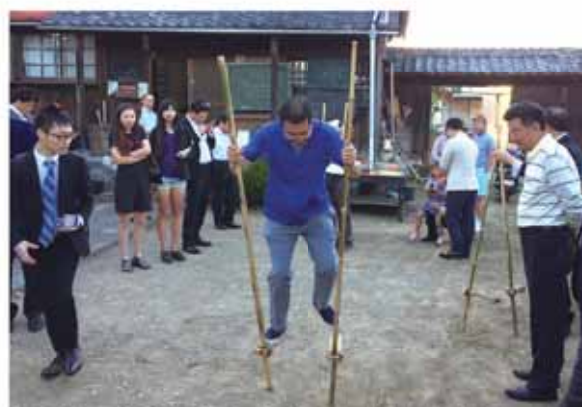
文化体験で竹馬遊びを楽しむ在日中国企業家の視察団

6月2日、在日中国企業の視察団が市を訪れ、NPO法人勝間田塾の皆さんの受け入れにより、古民家や日本の伝統的な遊びを楽しみました。 視察団は、竹とんぼや竹馬遊びのほか、地元で採れた茶葉や紫えんどうを使った料理を味わうなど日本文化を満喫。文化体験後には、沿道の小川でホタルを観賞し、幻想的なホタルの明かりを堪能しました。 この活動は、市が取り組むMIJBC事業（対日投資促進事業）の一環として実施したものです。