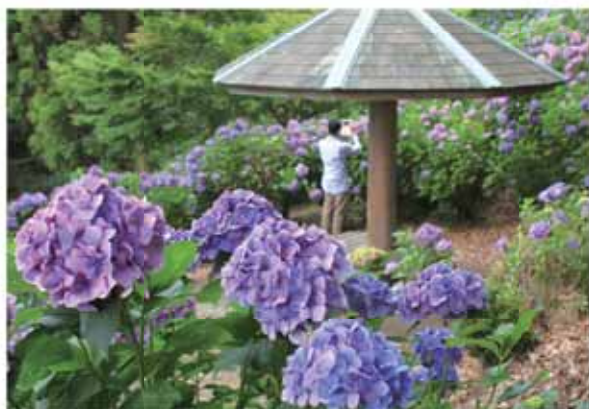
公園内の斜面一面に咲き誇るアジサイ