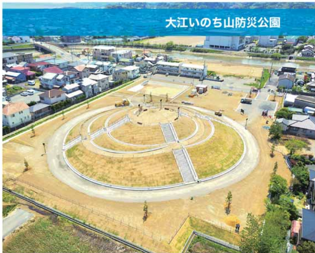
大江いのち山防災公園