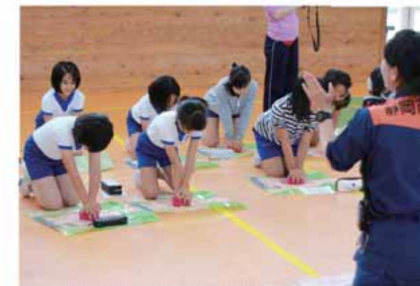
消防署員の指導のもと心肺蘇生法を学ぶ児童