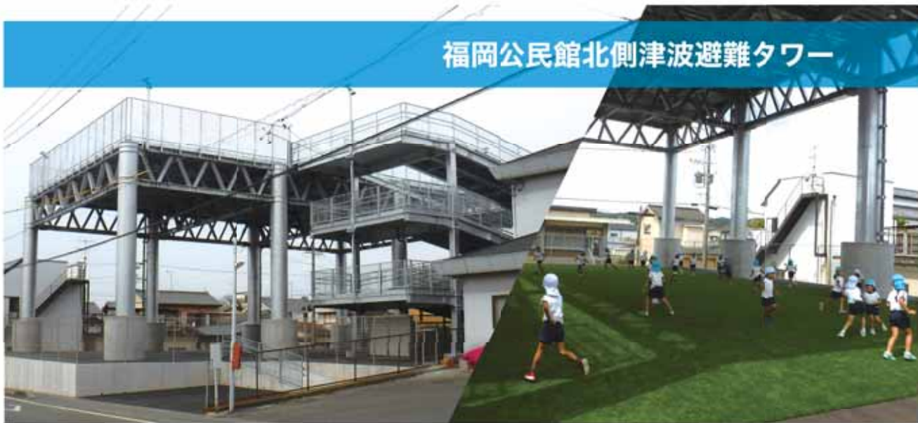
福岡公民館北側津波避難タワー