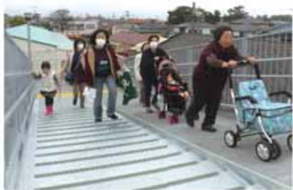
津波避難タワーを利用した避難訓練