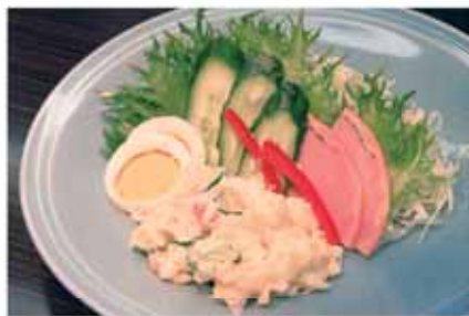
減塩ポテトサラダ (K Oマート 相良店)