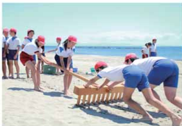
グループで協力して塩田づくりに取り組んだ児童たち

相良小学校6年生97人は6月5日、相良海岸にある、さがら塩づくり体験工房「茶々塩屋敷」で塩づくり体験をしました。 児童たちは、生涯学習ボランティア協議会「スマイル」の指導を受け、マンガやモッコウなど慣れない道具に苦勞しながらも、みんなで協力して伝統の揚浜式による塩づくりに挑戦しました。 体験した児童は「昔はこんなに大変な作業をして塩を作っていたなんてすごい」と話し、塩のありがたさを実感しました。