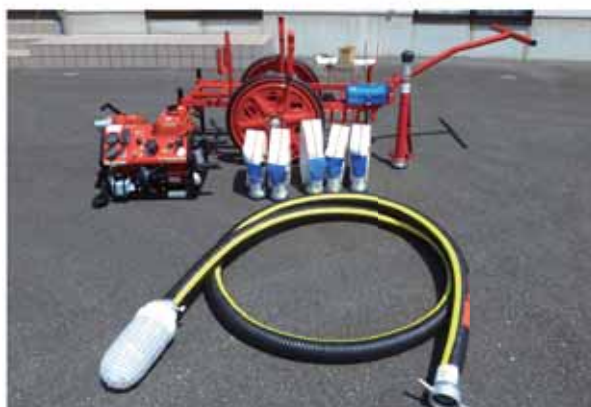
整備された可搬ポンプや吸管、消防ホースなどの資機材

神奈川区自主防災会では6月、宝くじの社会貢献広報事業として、一般財団法人自治総合センターが行う「地域防災組織育成助成事業」を活用して、消火活動で使用する資機材を整備しました。 整備した資機材は、可搬ポンプ（C-1級）やポンプ用台車、吸管、管鎗、消防ホースです。 この事業によって、自主防災会の充実や強化が図られるとともに、災害時の初期消火活動など地域の安全安心を守るために、有効に資機材が活用されます。