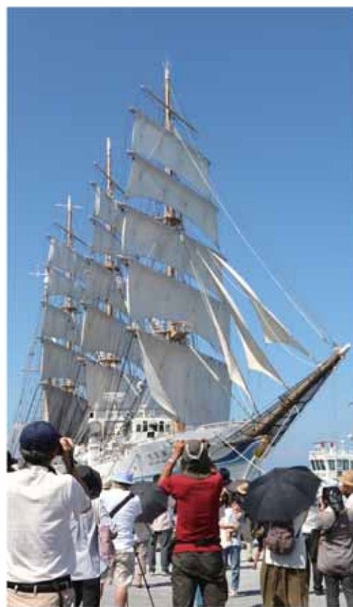
海の貴婦人と呼ばれる帆船「海王丸」