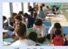
ブロックスタート

子どもとゆったり過ごしたいとき、同年齢の子どもを持つ仲間がほしいとき、子育てにちょっと疲れたときなどに、子どもと一緒に静岡県認定「子育て未来マイス