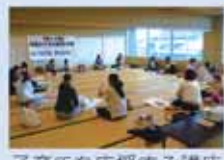
子育てを応援する講座