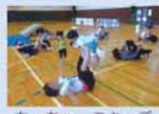
ちっちゃっこキッズ