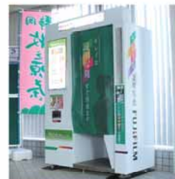
相良庁舎1階ロビーに設置されている自動証明写真機

マイナンバー 自動証明写真機からマイナンバーカードの申請ができます 問い合わせ 相良窓口課 神谷 ☎(53) 2604