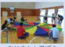
お父さんと遊ぼう

親子で楽しい行事に参加すると、友達との交流も深まります。また、子育ての情報交換もできます。