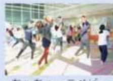
ちっちゃっこベビー