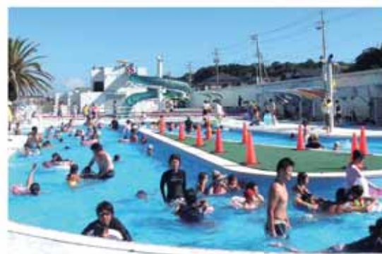
流れるプールやウォータースライダーを楽しもう