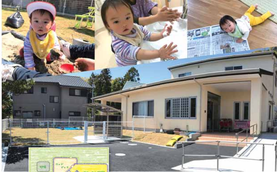
住所：牧之原市波津852番地1 電話：☎0199