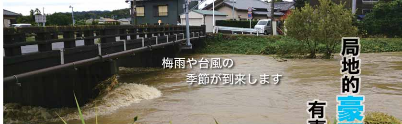
梅雨や台風の季節が到来します

近年、全国各地で局地的豪雨や台風による、大規模な風水害や土砂災害が発生しています。市でも、ここ数年の降雨状況が局地的・短時間豪雨化しているほか、接近する台風も巨大化傾向にあり、災害が発生する危険度が高くなっています。これらの危険から身を守るためには、最新の気象情報などに注意し、市から避難の呼びかけがあったときには、正しく迅速に行動することが重要です。家庭や地域で風水害や土砂災害について理解し、有事の際には、適切に行動できるよう確認しておきましょう。