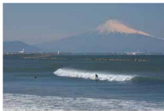
景観賞に選ばれた写真「富士に見守られて」