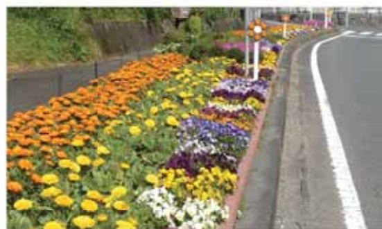
色鮮やかな花が咲き誇る道路沿いの花壇(女神花壇)

「平成28年度ふじのくに花の都しずおか・花緑コンクール」の地域花壇の部で、牧之原市花の会が最優秀賞を受賞しました。コンクールは、「花咲くしずおか」運動の実践と普及のため、学校や職場、地域などの花壇づくり、緑化への取り組みを対象に行っているものです。市花の会は市内17地域で227人が、道路沿いの花壇整備や花壇周辺の清掃、