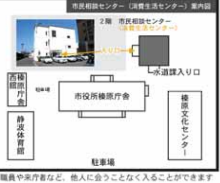
*職員や来庁者など、他人に会うことなく入ることができます