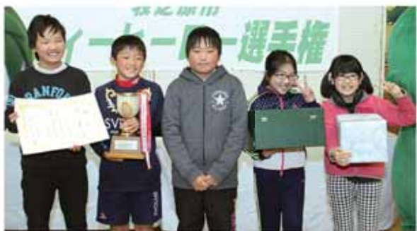
団体の部で優勝した相良小B

今回で第8回目 第1回目に出場した小学生も今では高校3年生です。この大会に参加して、多くの人が学んでいます。 競技は個人戦と学校対抗の団体戦（1チーム5人）で行われ、市内で生産された5種類のお茶（深蒸し煎茶、普通煎茶、ブランド茶「望」、つゆひかり、釜炒り茶）を、茶葉の外観や香り、色、味で当てる審査で、点数を競い合いました。 また、「市の茶園面積は市全体の面積の約何分の1か」