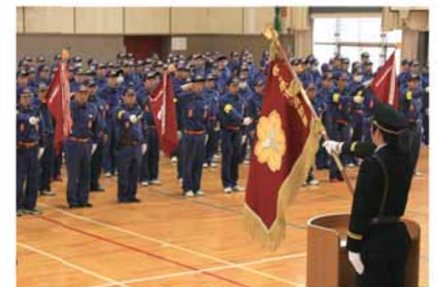
団旗に対し敬礼を行う消防団員