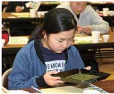
茶葉の「外観・色」を審査