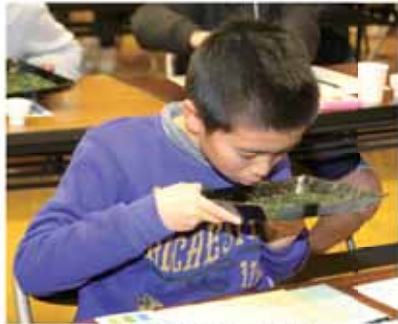
茶葉の「香り」を審査