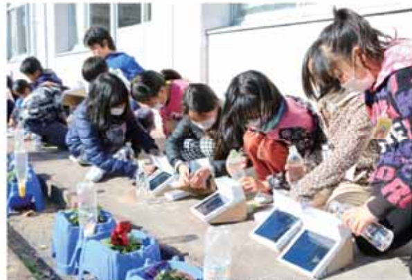
太陽熱温水器模型キットを使い実験を行う児童