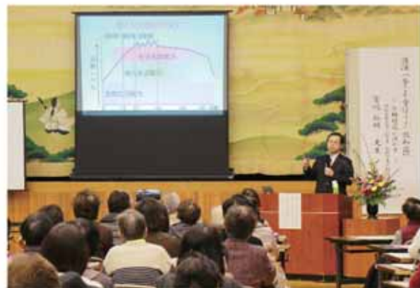
宮嶋教授の話真剣に聞く参加者

参加者は、わかりやすい説明に大きくうなずきながら、認知症の知識や対応策を学びました。