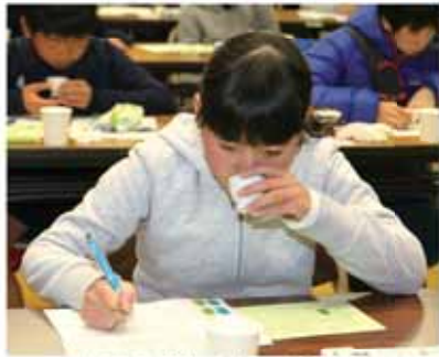
お茶の「色・味」を審査