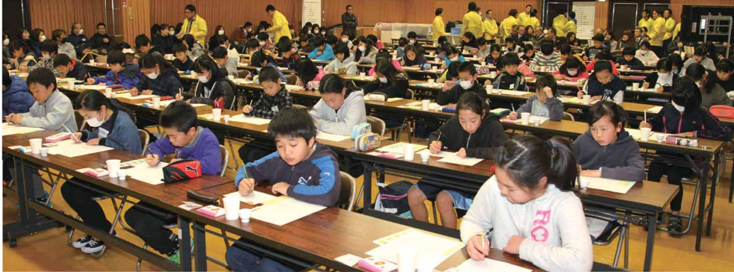
お茶のクイズに挑戦する児童たち