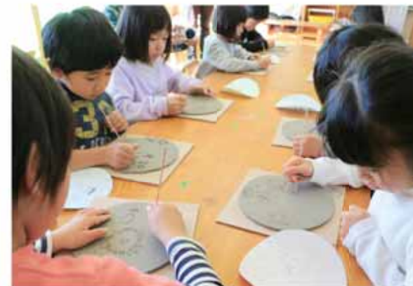
真剣な表情で好きな絵をお皿に描く園児

完成したお皿は、長谷川さんの窯で焼かれ、ピンクや青の釉薬で着色されたあと、約1カ月後に園児の元に届けられます。