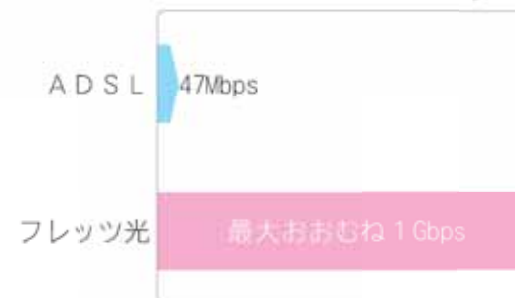
最大通信速度比較（例）

例えばNTT西日本の光ブロードバンド「フレッツ光」の場合、最大通信速度がこれまでのADSLの47Mbps（メガビット毎秒）から、最大おおむね1Gbps（ギガビット毎秒）になります。 これにより、パソコンやスマホ、ゲーム機、テレビなどでの情報端末が、快適に楽しめます。 *例に挙げている最大通信速度は、技術規格上の最大値であり、実務速度ではありません。利用環境や状況などによっては、通信速度が遅くなる場合があります。