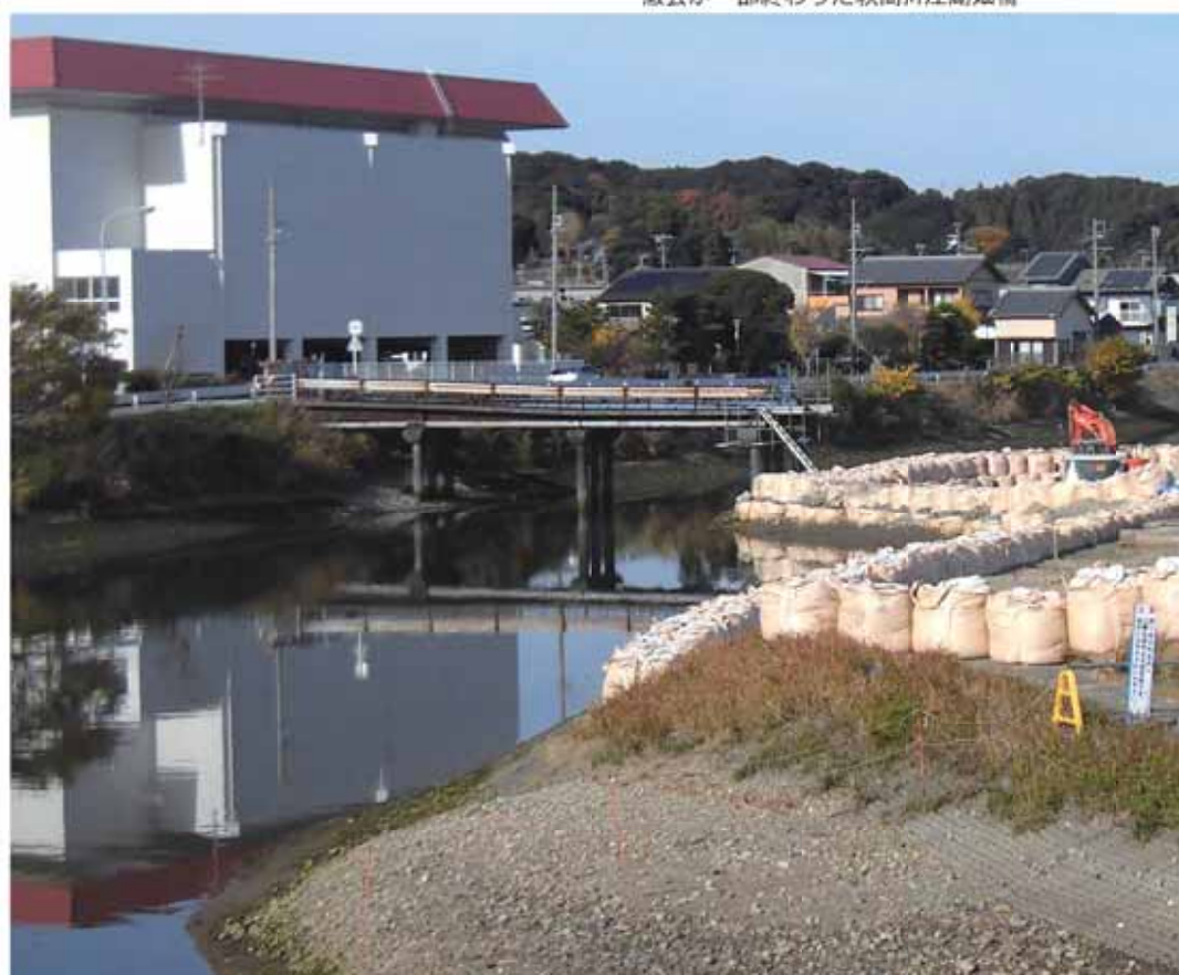
撤去が一部終わった萩間川江湖畑橋

県では、豪雨による農地などへの冠水や家屋の浸水被害を軽減するため、河川の整備に取り組んでいます。 本年8月から2級河川萩間川の川幅を広くする広域河川改修工事を進めており、その中の江湖畑橋撤去工事が大江側で完了しました。今後、相良中学校側でも同じく工事を進めていきます。 橋の撤去が終了後、大江側護岸を湊橋から上流に向けて、河川の整備を行う予定です。