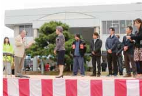
まきのほら産業フェアで認定書を受け取る出品者