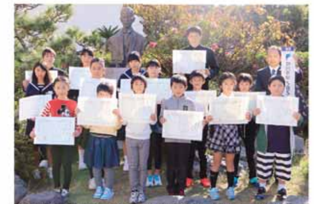
鈴木梅太郎博士像の前で受賞を喜ぶ作文コンクール受賞者