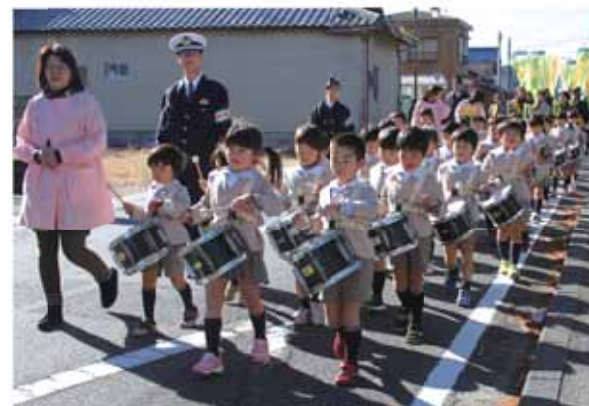
交通安全パレードで行進する川崎幼稚園の太鼓隊

参加者は、園児たちの太鼓隊を先頭に、のぼり旗や横断幕を掲げながら、約1キロメートルを太鼓隊の奏でる軽快なリズムに合わせて行進し、地域の皆さんに「交通安全」を呼び掛けました。