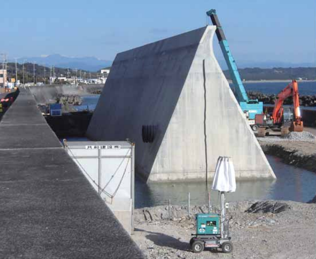
東沢川北側で工事を進めている高さ10メートルの防潮堤