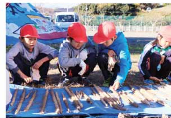
大小さまざまな自然薯を収穫した児童

収穫を体験した児童は「自分たちで育てた自然薯が大きく育っているのか、ドキドキしながら収穫しました」と話しました。