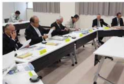
商品の最終選考をする審査員