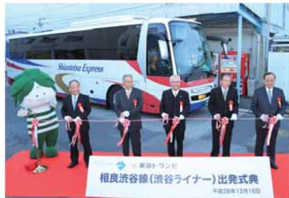
出発するバスの前でのテープカット

秘書広報課 ☎0052 ✉seisaku@city.makinohara.shizuoka.jp