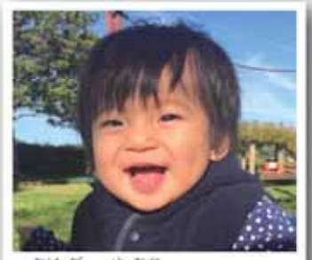
まきのほら 武田 諭高くん(1歳) 平成28年1月4日生(勝間田) 車が大好きにこにこ笑顔。車を見ると「ぶっぶっー、ぶっぶっーぶっー!!」と大喜び!