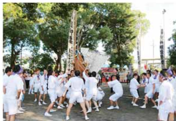
大きな掛け声とともに荒々しく御船を担ぐ船若たち