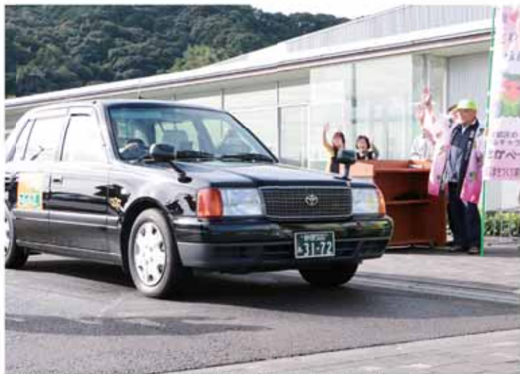
坂部区民や関係者に見送られながら出発した「さかべ号」

市指定無形民俗文化財「神明神社の御船神事」(細江区)が10月8日に行われました。神事は、江戸時代後期から続いている、海運興隆と海上安全を祈願する伝統行事です。船若と呼ばれる地域の青年が、長さ約2.6メートルの御船を担ぎ「ヤッサー、コラサー」の掛け声に合わせて、船が荒波を越えていくように激しく前後に傾けながら敷地内を練り歩きました。訪れた観客は、その姿を写真や動画撮影をしながら、大きな歓声と拍手を送っていました。