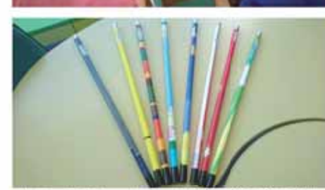
カラーバリエーションも豊富。選ぶ楽しみも、「自分の好きな柄をチョイス」

新吹き矢を楽しもう 市では、市民の健康増進のため、各種健康講座を中心に吹き矢を普及してきました。しかし、用具製造元の生産終了に伴い、活動の継続が難しい状況となります。