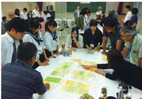
さまざまな世代の人たちが福祉について語り合う

「身近な福祉について語ろう」が10月2日、椋原文化センターで行われ、中学生や大学生、民生委員、社会福祉協議会職員など約70人が参加しました。「みんなが気持ちよく暮らすには」をテーマとした意見交換では、「困っている人がいたら声をかける」「福祉のことを勉強」など、自ら取り組もうとする積極的な意見が出されました。参加した中学生は「家族や友達と話をし、いろいろな人の意見を聞きたい」と話しました。