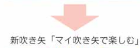
新吹き矢「マイ吹き矢で楽しむ」