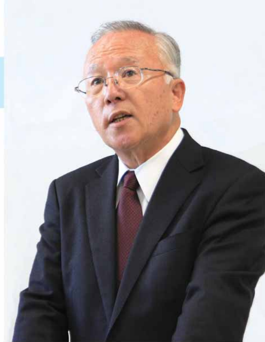
牧之原市長 杉本基久雄（すぎもと・きくお）

1957（昭和32）年牧之原市生まれの60歳。静岡県立島田商業高等学校卒業。旧榛原町消防団副団長、旧榛原町役場奉職、牧之原市都市整備課長・秘書広報課長・総務部長・副市長を歴任し、平成29年10月30日に牧之原市長就任。