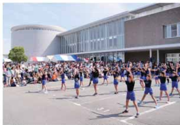
「青い海と白い波のソーラン」を披露する川崎小の児童