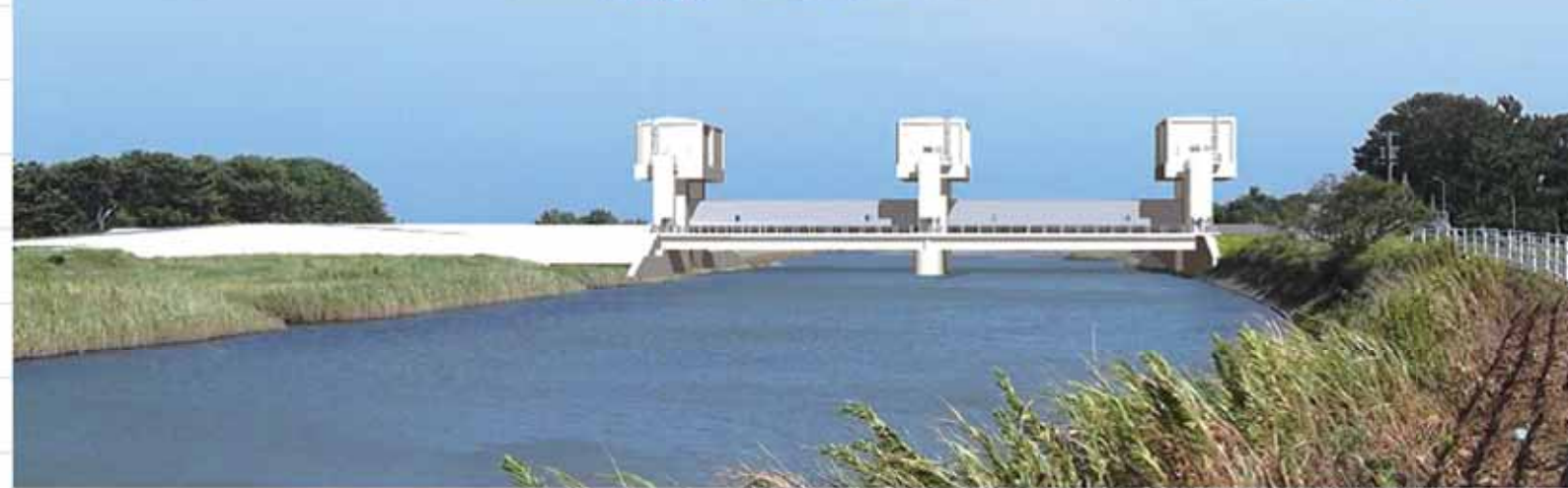
坂口谷川河口の耐震水門完成イメージ図

二級河川坂口谷川の河口付近（細江地区）では、想定される津波（東海や東南海、南海地震などの100年から150年間隔で発生する地震）による被害の軽減を図るため、静岡県島田土木事務所が耐震水門の整備を進めています。この耐震水門は、「県地震・津波対策アクションプラン2013」に基づき、平成34年の完成が予定されています。