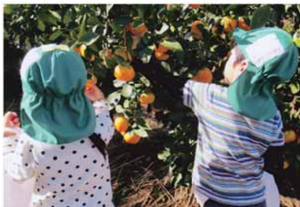
甘そうなみかんを選びながら収穫する園児

10月26日、牧之原保育園の4・5歳児59人がふるさとの森（勝間田区）周辺のみかん畑でみかん狩りを体験しました。この畑は、牧之原保育園に通う園児の家族が管理するみかん畑で、園児らは甘いみかんの見分け方や採り方を教えてもらいながら、次々とみかんを持ってきたビニール袋へと入れていきました。みかんを食べた園児は「いいにおい」「甘いね」といいながら喜びました。収穫したみかんは、家族へのお土産として持ち帰りました。