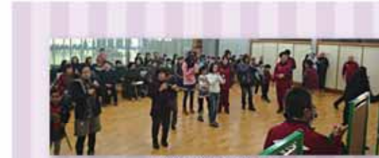
前年度大会の様子