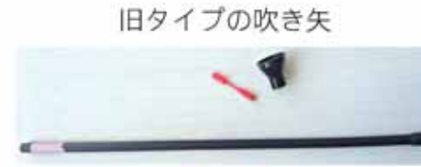
旧タイプの吹き矢