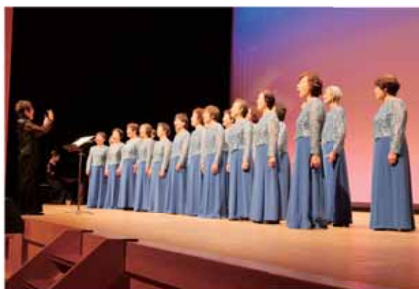
美しい歌声を披露する椋原女声コーラス