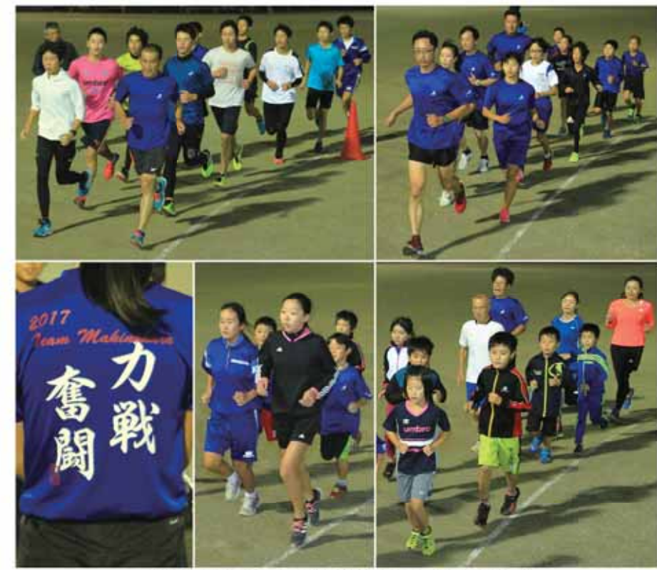
「力戦奮闘」を合言葉に厳しい練習を重ねる市駅伝チーム