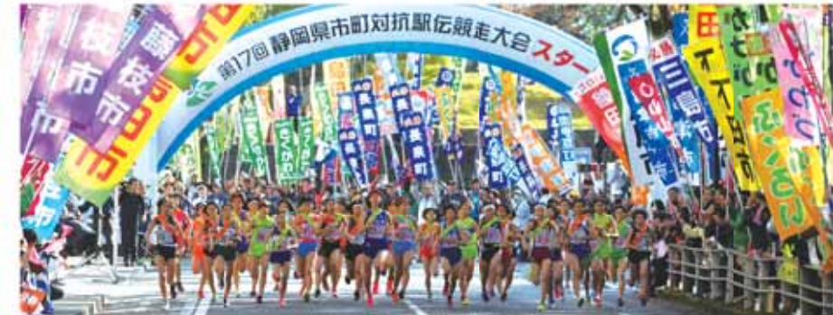
前回大会のスタートの様子

生中継 SBSテレビ(午前9時30分〜午後0時50分)・SBSラジオ(午前9時45分〜午後1時) 問い合わせ 健康推進課 政野 ☎(23)0025