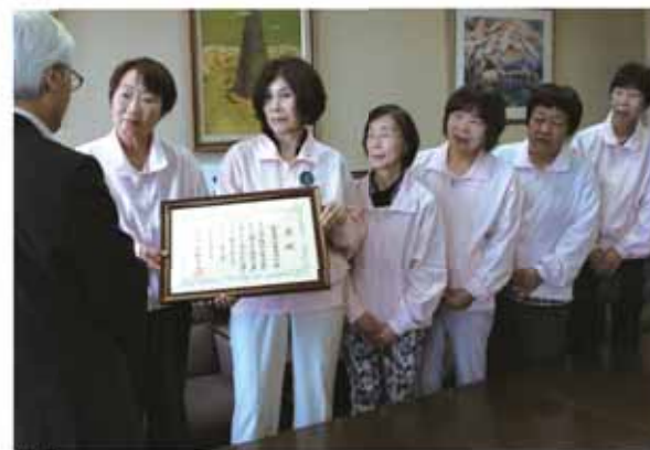
市長に受賞の報告をする市消費者協会のメンバー

講座では寸劇やグループワークなど、参加型の講座を実施しており、体感できる消費者教育に取り組んでいます。