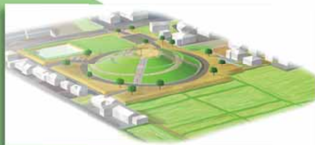
大江いのち山の完成予想図