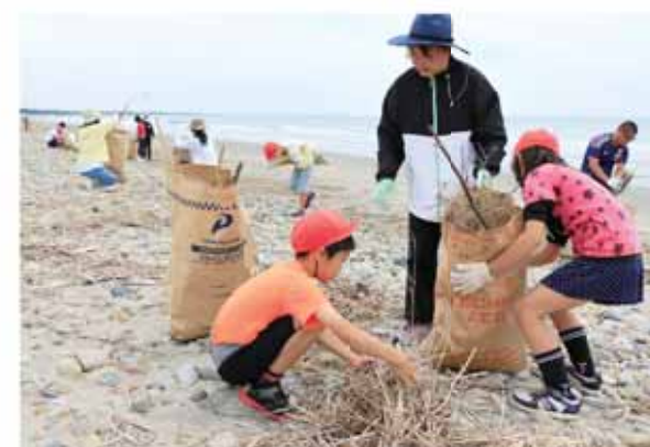
流木や木の枝などを拾う日赤奉仕団の皆さんと児童たち