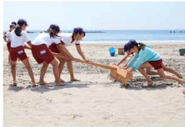
力を合わせて塩づくりに取り組む児童たち