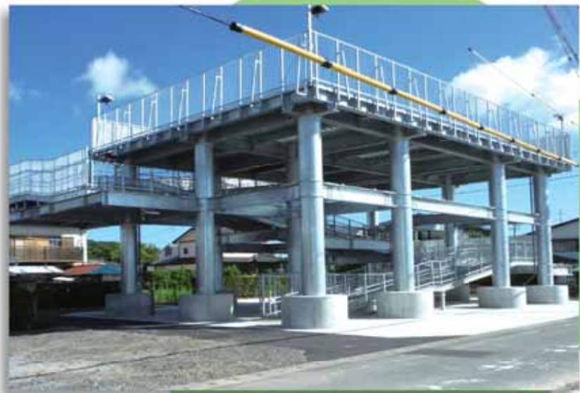
Fブロック（市営住宅東海団地跡地）に完成した津波避難タワー