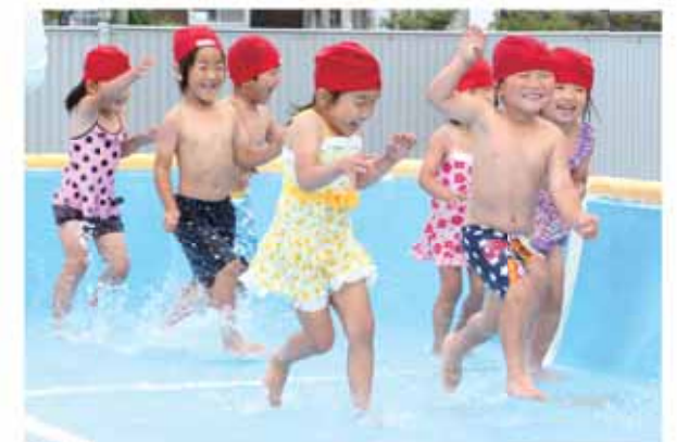
プールでの水遊びを楽しむ園児たち