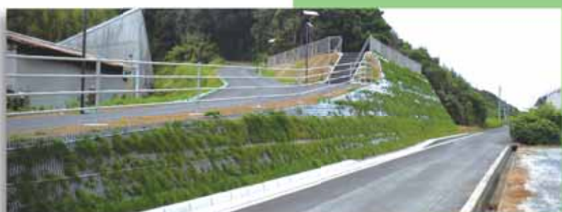
5月に完成した地頭方3号津波避難地・避難路（下側）