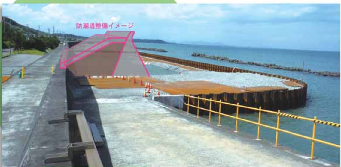
防潮堤整備イメージ