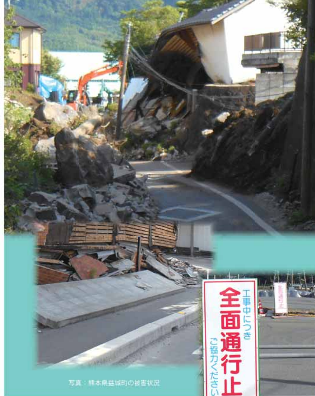
写真：熊本県益城町の被害状況