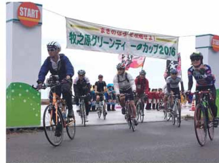
ログスポットを目指し静波海岸をスタートする参加者たち

参加した児童らは、先生の話に真剣に耳を傾けながら実験や体験などを行い、空気の秘密について楽しく学びました。