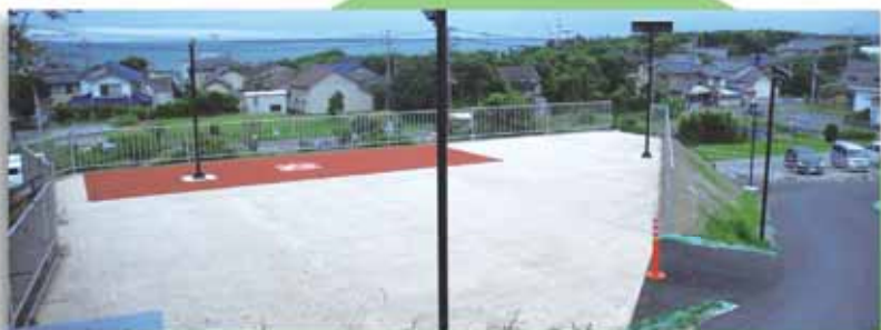
5月に完成した地頭方3号津波避難地・避難路（上側）

（*）レベル1津波とは、本県がこれまで地震被害想定の対象としてきた東海地震のように、発生頻度が比較的高く（駿河・