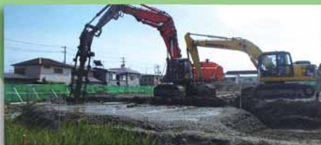
パワーブレンダー工法による地盤改良工（大江いのち山）