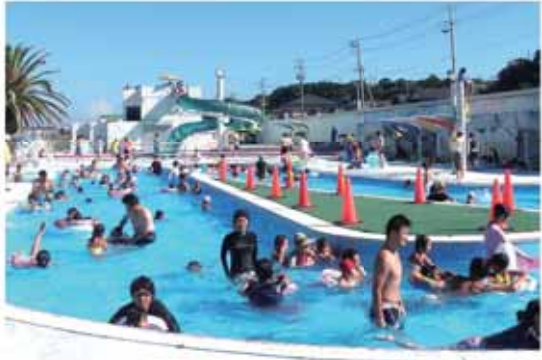
流れるプールやウォータースライダーを楽しもう

遊び いよいよ夏本番、みんなでプールに行こう！ シーサイドプール地頭方が7月29日にオープン 問い合わせ 健康推進課 政野 ☎(23) 0025