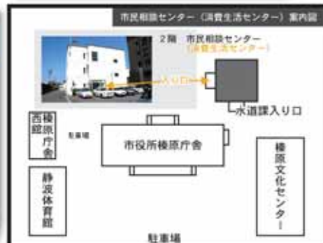
職員や来庁者など、他人に会うことなく入ることができます

期日 5月20日(日) 時間 13:30～16:00 会場 相良保健センター 地域包括センターさがら ☎1900