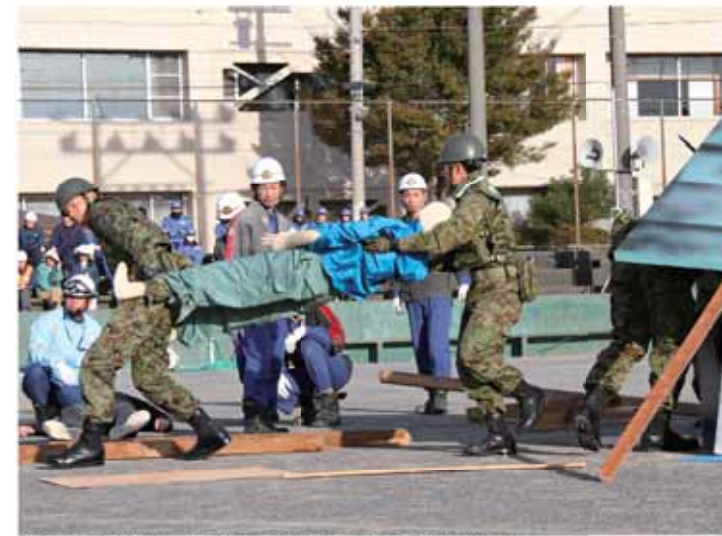
自衛隊と消防署、消防団が連携した救出訓練の様子

また、サプライズ企画として、原始時代の過去から来た名乗るサンタも登場。室内に音楽が流れ始めると、軽快な動きで園児たちと一緒にダンスを楽しみました。