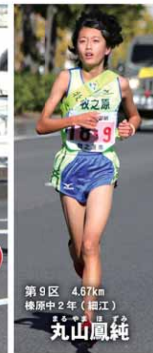
第9区 4.67km 椋原中2年(細江)