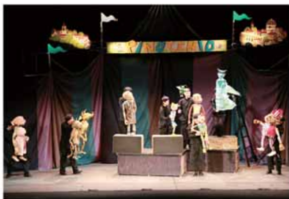
人形劇団むすび座による「ピノキオ」上演の様子

子どもたちは、人間と同じくらいの人形や大きなサメが、観客席を飛び回る姿に目を丸くし、大きな拍手を送るなど楽しんでいました。