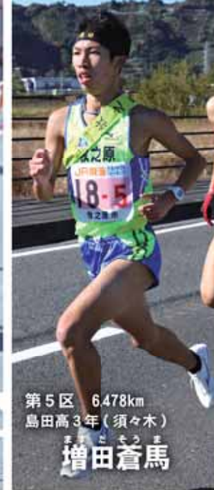
第5区 6.478km 島田高3年(須々木)