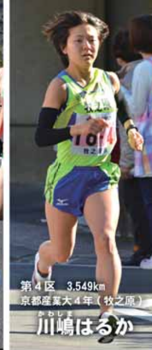
第4区 3.549km 京都産業大4年(牧之原)