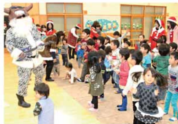
過去から来たサンタと一緒に踊る園児たち