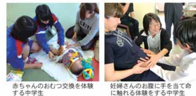
赤ちゃんのおむつ交換を体験する中学生

元気な いかにあそび！ NO. 81 未来パパママ子育て体験を市内の中学校で実施 市では、市内の各中学校で毎年、中学3年生を対象に「命の大切さ」や「子どもを産み育てることの楽しさ」「自分や他者を大切にすることを育てる」ため、未来パパママ子育て体験を2日間実施しています。 この事業は、平成18年度から始まり、地域の妊婦、親子、お父さんボランティアの協力を得ながら行っています。