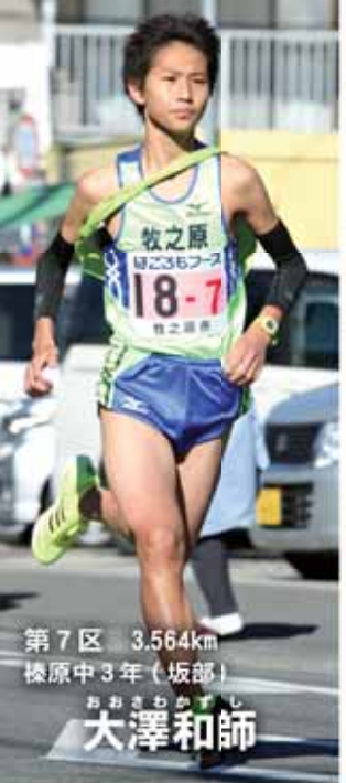
第7区 3.564km 椋原中3年(坂部)