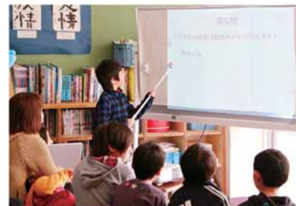
ICTを活用してクイズ形式で研究の発表をする児童

また、ビタミンI(愛)作文コンクールでは、814人の短歌から10人が表彰されました。