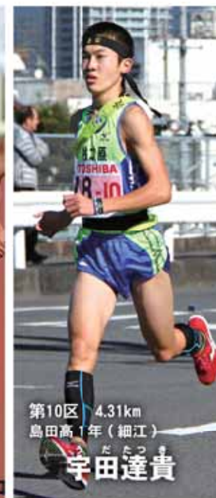
第10区 4.31km 島田高1年(細江)