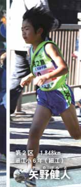
第2区 1.848km 細江小6年(細江)