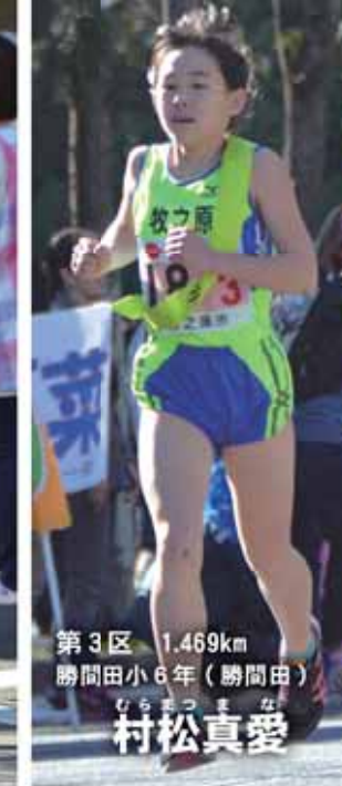
第3区 1.469km 勝間田小6年(勝間田)