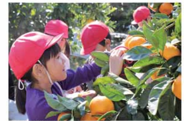
みかん狩りを楽しむ児童