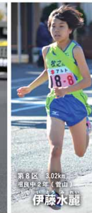
第8区 3.02km 相良中2年(菅山)