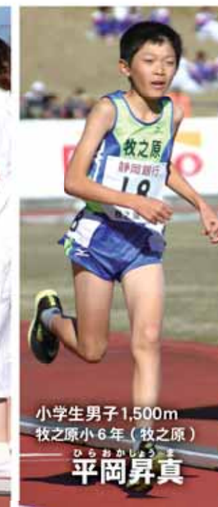
小学生男子1,500m 牧之原小6年(牧之原)