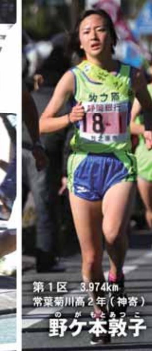
第1区 3.974km 常葉菊川高2年(神寄)