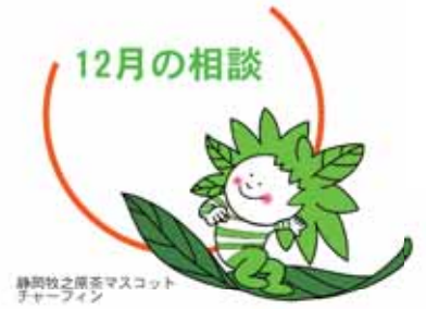
静岡牧之原マスコットキャラクター

12月の相談日です。日々の生活の中で、誰かに相談したいと思っ... 秘密は厳守されますので、ひとりで解決しようとせず、まずは相談してみてもいいですか。