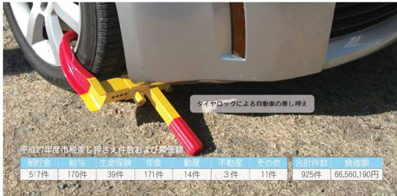
タイヤロックによる自動車の差し押え