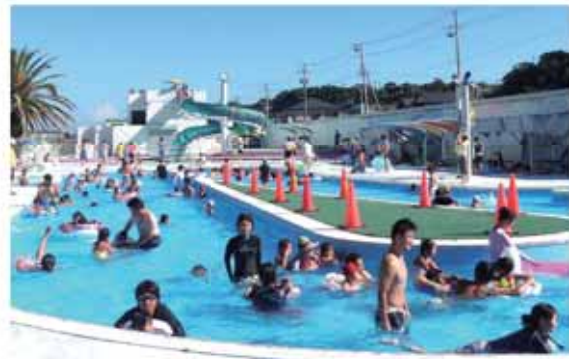
ウォータースライダーでちょっとしたスリルを味わおう

*オープン当日（7月25日）と県民の日（8月21日）は無料です。 *営業期間中の問い合わせは ☎1782。