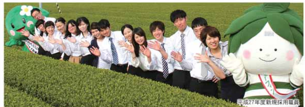
平成27年度新規採用職員