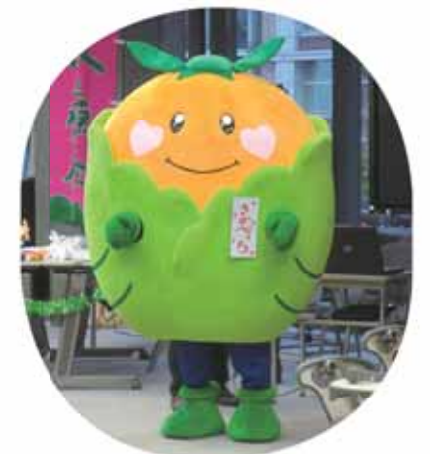
坂部のゆるキャラ「さかべっち」誕生