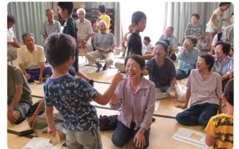
坂部地区での高齢者の居場所づくりの活動

地域の課題の発見や解決に向け、地域と行政が一緒になって、みんなで対話をしながらまちづくりを進めるものです。 また、この取り組みを通じて、地域のさまざまなことを学ぶとともに、協働のまちづくりを進める人を育成することも目的としています。