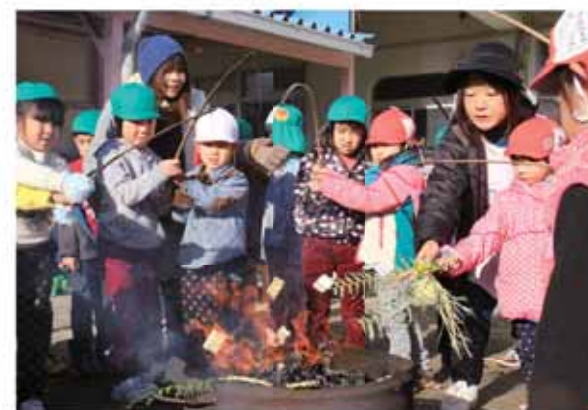
正月飾りを燃やす火で餅を焼く園児

また、正月飾りを燃やす火でお餅を焼き、「熱いけどおいしい」とうれしそうに食べていました。