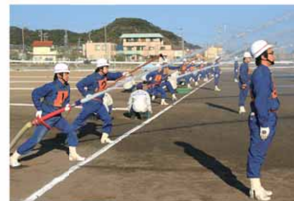
小型ポンプ操法で一斉放水する消防団員