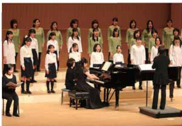
親子で一緒に合唱を楽しむコーラス♪フレンズ