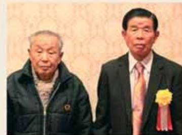
牧之原市シルバー人材センターカラオケ愛好会

平成11年の設立以来、毎年福祉施設などを歌や舞踊をもって慰問し、地域における高齢者の支援、福祉の増進に貢献されました。