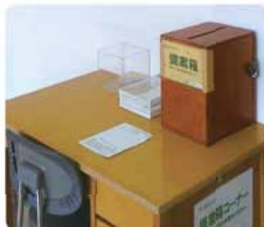
売店前ラウンジにある提案箱

榛原総合病院では、住民の皆さんの生命を守るため、24時間365日の診療体制をとっています。また、病院内に提案箱を設置し、寄せられた皆さんの意見を必ず院長が確認し回答することで、サービスの向上に努めています。