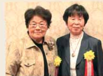
さがら牧之原花の会

平成3年の設立以来、地域における花壇づくりや環境美化活動に活発に取り組み、美しく潤いのあるまちづくりに貢献されました。