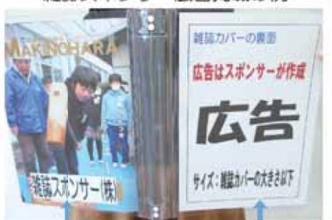
カバー表面にスポンサーの「名称」を掲載