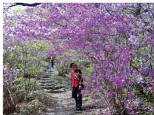
景観賞に選ばれた「花につつまれて」(勝間田公園)

多くの市民の皆さんに、市内にある豊かな景観を知ってもらおうと、昨年8月から11月までの間、第4回目となる「まきのはら景観写真」を募集しました。 合計78点の作品が集まり、審査の結果、最高賞である景観賞1点、