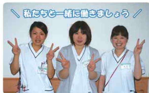
私たちと一緒に働きましょう 榛原総合病院の新人看護師さん(牧之原市出身)