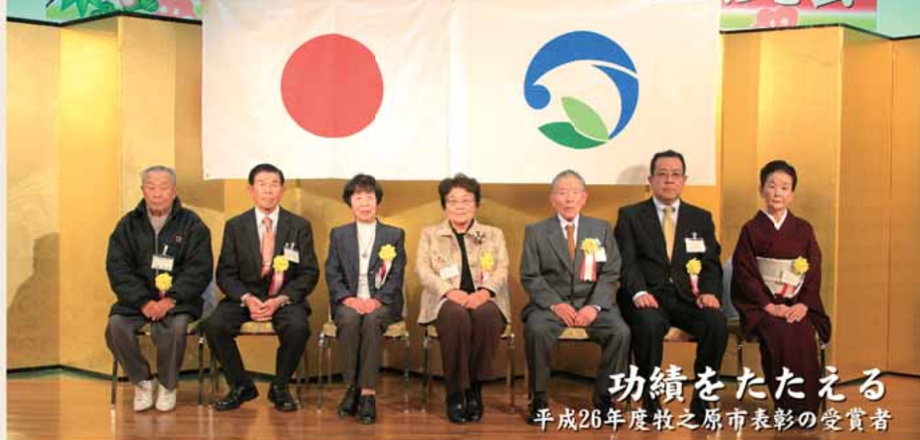
功績をたたえる 平成26年度牧之原市表彰の受賞者

さまざまな分野で永年にわたり活躍され、市の発展に寄与された個人や団体を表彰する「牧之原市表彰」が1月5日、「牧之原市新春初顔合わせ会」に先立って執り行われました。本年度は、3人の個人と2団体が表彰されました。