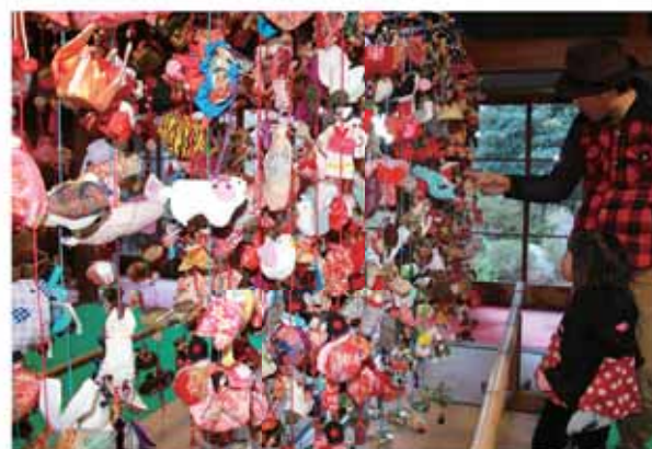
約100点の華やかなつるし飾りを楽しむ親子

市内や近隣市町の愛好家が制作した作品約100点が展示され、訪れた人たちは、約2メートルの高さからつるされたサルやイヌなどの動物、巾着やダルマなどの縁起物をかたどった、色鮮やかなつるし飾りをじっと見つめていました。