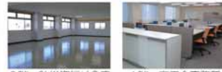
3階 防災資機材倉庫