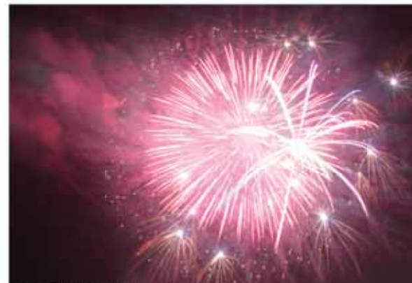
地域に真夏の訪れを告げる恒例行事

水中花火やスターメインなど、色鮮やかな花火に、集まった浴衣姿の若者や家族連れなどは、大きな歓声を上げていました。