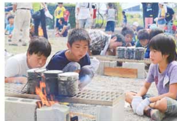
火や煙と格闘しながら飯ごうで米を炊く