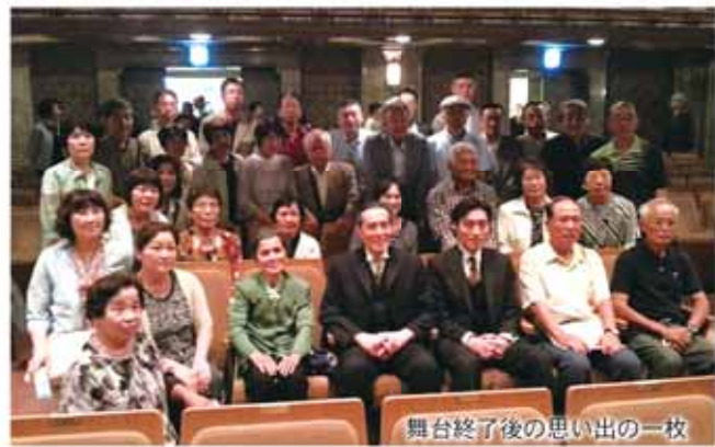
興台終了後の思い出の一枚