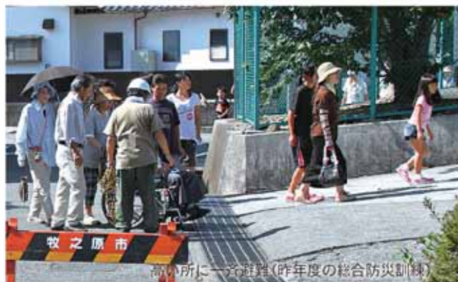
高い所に一方通行(昨年度の総合防災訓練)