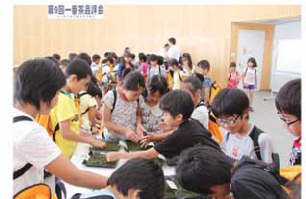
出品された茶葉の色や感触を確かめる小学校の児童