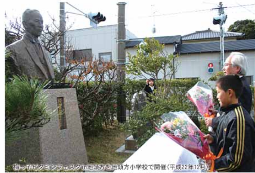
梅っ子ビタミンフェスタin地頭方を地頭方小学校で開催(平成22年12月)