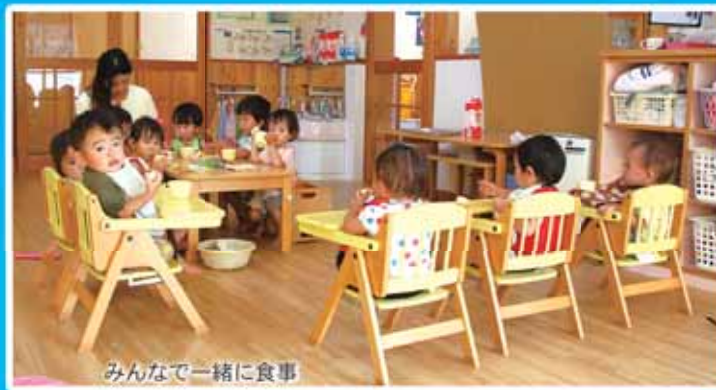
みんなと一緒に食事