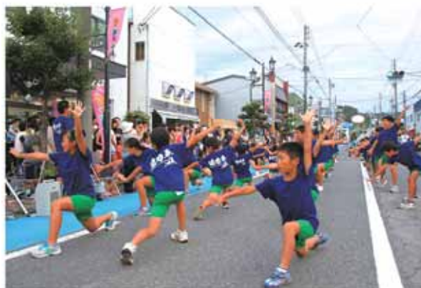
よさこいソーランなどを披露する牧之原小学校の児童

大沢公園では、恒例の移動ふれあい動物園が開設され、訪れた子どもたちは30種類以上の動物とふれ合いました。本通りでは、市内各小学校のよさこいソーランやフラダンス、大道芸人のパフォーマンスなどが繰り広げられ、夏の商店街を盛り上げていました。