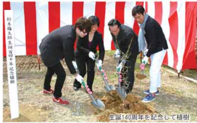
生誕140周年を記念して植樹