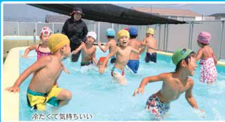
冷たくて気持ちいい