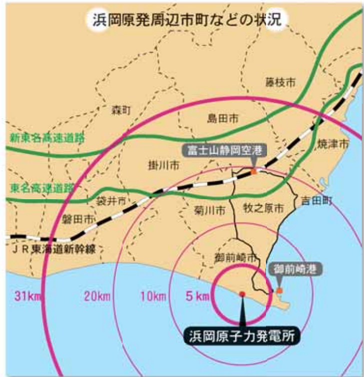
浜岡原発周辺市町などの状況

内には、東海道新幹線や東名高速道路、新東名高速道路、東海道線、国道1号など日本の東西を結ぶ大動脈が走っています。さらに、富士山静岡空港や御前崎港など主要な交通網が含まれます。また、周辺には、自動車産業など、日本のものづくりを支える主要産業の事業者や中小の関連企業も集積しています。流通や経済への打撃、そして、私たちの生活にも大きな影響が生じる可能性があります。