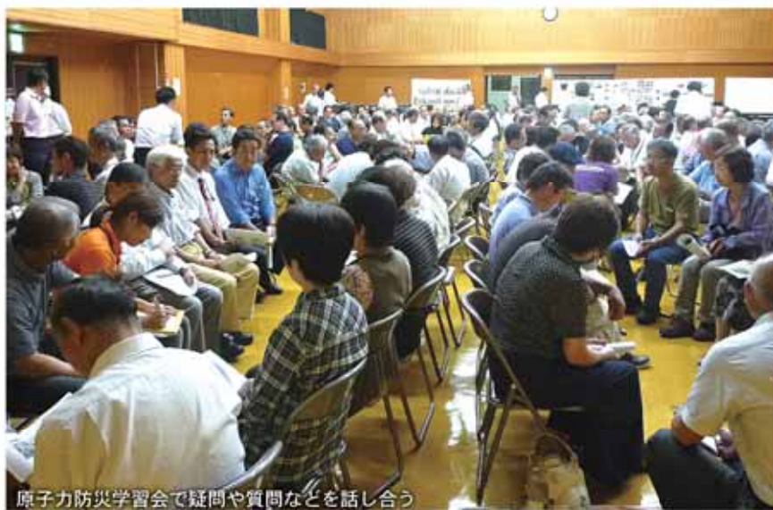
原子力防災学習会で疑問や質問などを話し合う

市では、これまでどおり市民の皆さんに原子力発電やエネルギー、原子力災害などに関する正しい理解と判断ができる学びの場を提供していくとともに、県が進める「広域避難計画」の策定状況を見極めながら、地区ごとの集合場所や避難の仕方など、皆さんと共に具体的な避難計画の策定に取り組んでいきます。