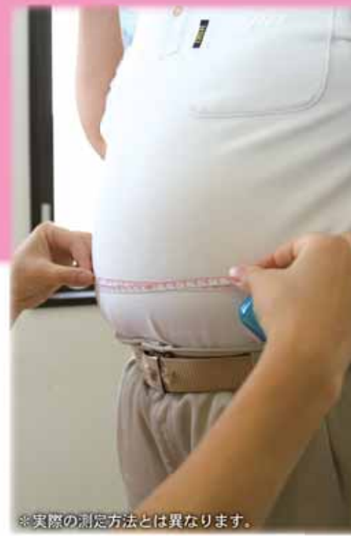
※実際の測定方法とは異なります。