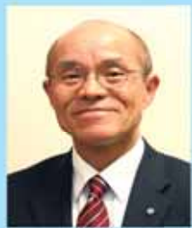
福島県南相馬市長 桜井 勝延