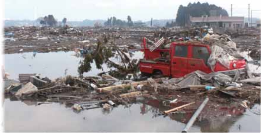
災害直後の南相馬市の様子