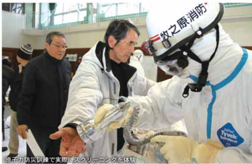
原子力防災訓練で実際はスクリーニングを体験