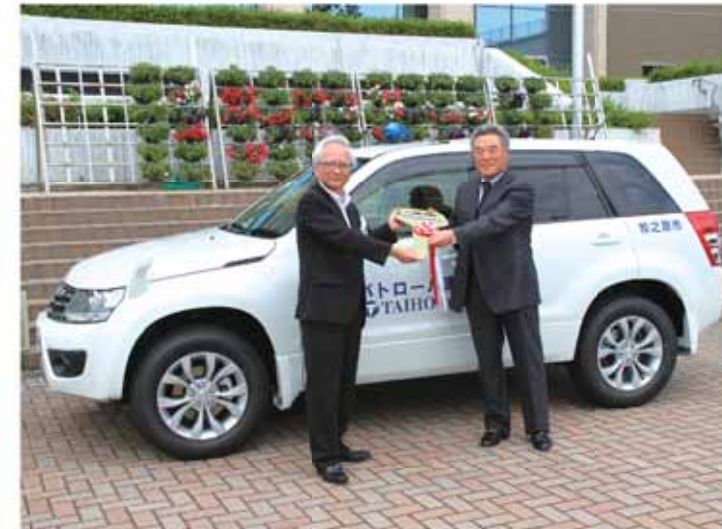
大豊株式会社の葉山社長からマスコットキーを受け取る市長

参加した児童は、「もっと資源を大切にしたい」と話し、省エネ活動の大切さや楽しさを学びました。