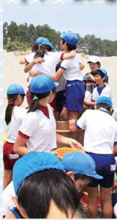
みんなで力を合わせて砂集めに挑戦