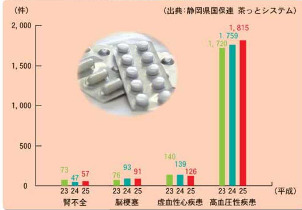
グラフ1 ■市国民健康保険の生活習慣病に関する件数

いると、それらが重なり、腎不全や脳梗塞、心疾患、高血圧性疾患といった重い病気の発症につながる可能性が高くなります。例えば、グラフ2の心疾患