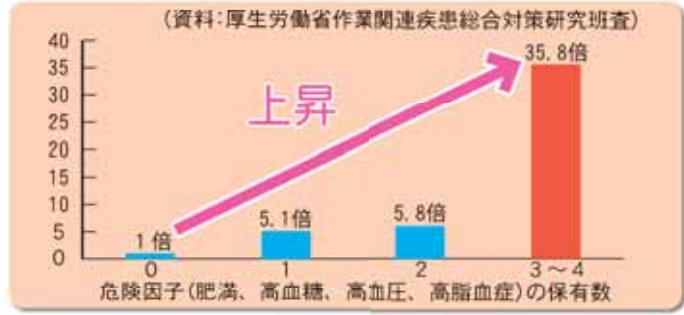
グラフ2 ■心疾患の発症危険度

一度、生活習慣病にかかってしまうと薬だけでは根本的に治りません。皆さんも自分だけは大丈夫と思わずに、まずは、特定健診を受診し、自分の健康状態をチェックし、いつまでも健康で元気に過ごせるようにしましょう。市では6月から特定健診を実施しています。指定された日に受診できない人でも榛原総合病院健診センターなどで行っていますので必ず受診しましょう。