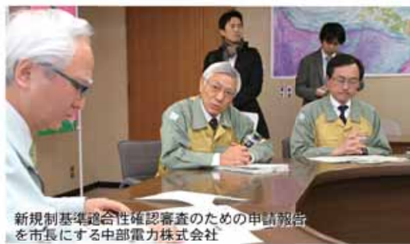
新規制基準適合性確認審査のための申請報告を市長にする中部電力株式会社

これを受けて中部電力では浜岡原発4号機の新規制基準適合審査の申請を原子力規制委員会に提出しました。3号機についても、平成26年度中の申請を目指しています。現在、中部電力が実施して