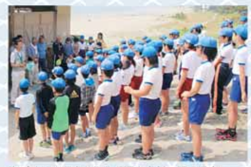
塩づくりの歴史や作業手順を真剣に聞く児童

梅雨の晴れ間に恵まれ、絶好の塩づくり日和となった6月3日、波津地先の海岸にある茶々塩屋敷で、相良小学校6年生の児童91人が、「揚浜式製塩法」による塩づくりを体験しました。 地元「スマイル」の教育ボランティア団から、塩づくりの歴史や作