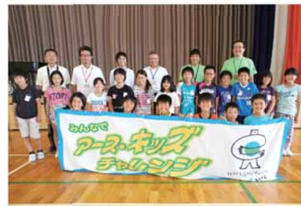
家庭でのエコ活動推進に意欲を燃やす児童たち