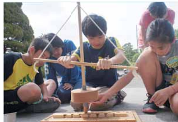
弥生時代の火起こしを体験する6年生の児童

昔の道具を使った火種づくりに苦戦するなど、児童たちは、「現代に生まれて良かった」と話していました。