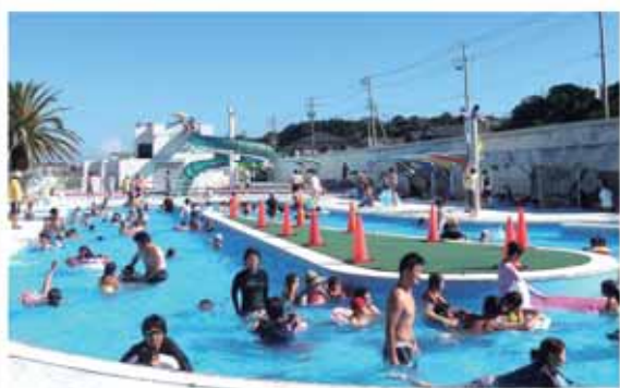
*ウォータースライダーでちょっとしたスリルを味わおう。

*オープン当日(7月26日)と県民の日(8月21日)は無料です。 *営業期間中の問い合わせ ☎58-1782。