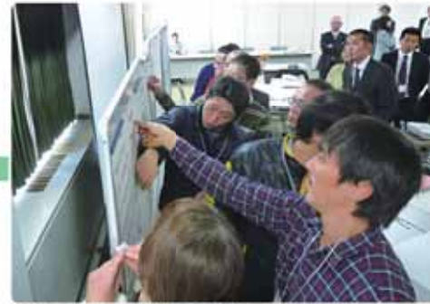
第2回では重点的に取り組む分野に投票

策定された計画が、行政だけでなく市民、地域、団体、企業など市全体で推進されるものとするため、市内のさまざまな分野で活躍している約30人のメンバーで構成する市民会議「NEXTまきのほら」を設置し、専門分野の知識を生かしながら総合的な視点で具体的な計画案を議論しました。 会議は平成25年12月から26年5月までの半年間で合計5回開催しました。参加者の平均年齢は43歳で女性が4割を占めるなど、若者や女性が多く、毎回熱心で活発な議論が重ねられました。