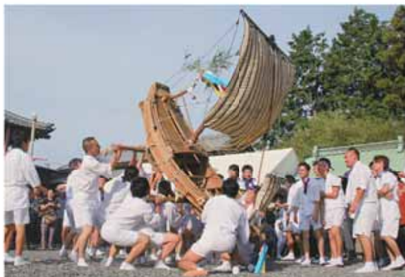
船若による練りが披露された神明神社の御船

船が荒波を越えていく様子を再現した姿は勇ましく、訪れた人たちは大きな歓声を上げ、盛んに拍手を送っていました。