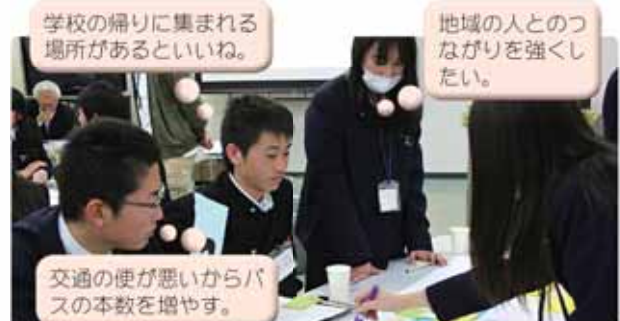
将来都市像の検討のため高校生(棟原高校・相良高校)の意見も確認

市を取り巻く多くの課題を解決し、「住みたい・住み続けたい」と思えるまちをつくるためには、行政だけでなく、市民みんなで取り組むことが必要です。来年度から始まる新たな総合計画を策定するに当たっては、多くの市民の皆さんに関わってもらいたいながらつくってききました。 問い合わせ 企画課 本間 ☎(23)0040