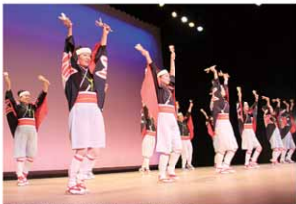
舞台上で披露される息の合った華麗な踊り