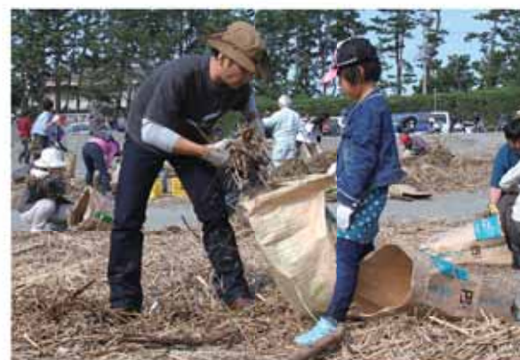
袋いっぱいにごみを回収する参加者たち

参加者は、「流木がたくさんあって大変でしたが、少しでも海岸をきれいにすることができて良かったです」と話してくれました。