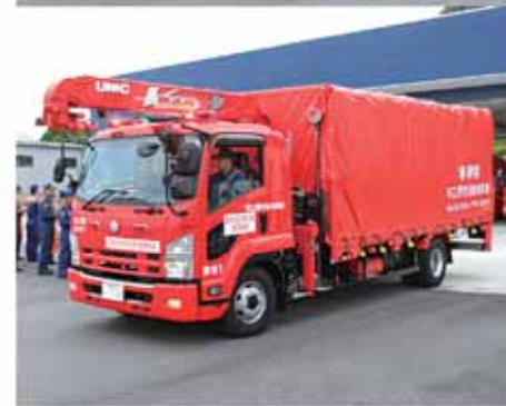
▲発隊式後に相良消防本部を出発