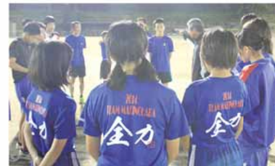
2014年のチームTシャツ。合い言葉は「全力」