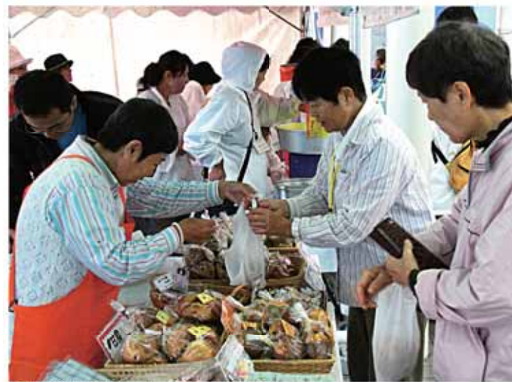
手作り商品などを販売するこづつみ作業所の皆さん

来客者は、「知らないお店は新鮮に感じ、つい、たくさん買ってしまいました」と喜んでいました。