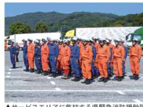
▲サービスエリアに集結する県緊急消防援助隊