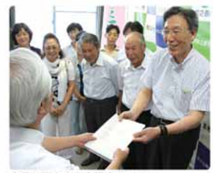
市長に答申する審議会のメンバー