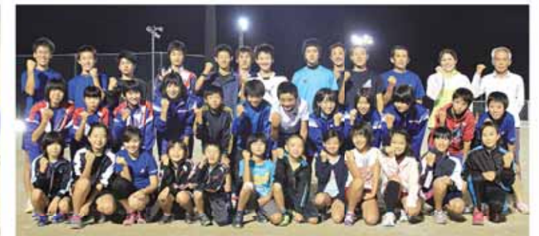
小学生から大人まで一丸となって頑張ります