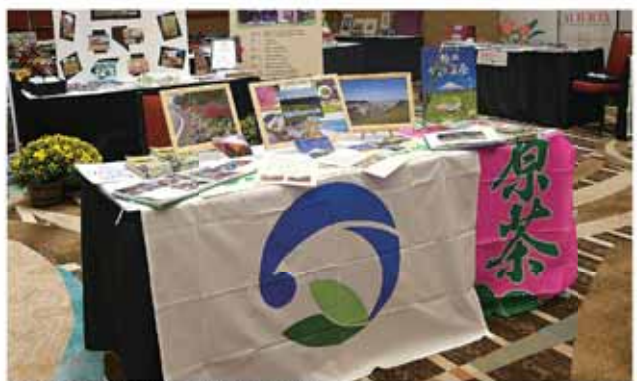
表彰会場で牧之原市を世界にPR