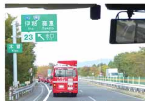
▲約6時間をかけ御嶽山を目指す部隊

災害はいつどこで発生するかわかりません。有事の際には、市外であっても緊急消防援助隊として、被災者のために活動することが使命だと考えています。