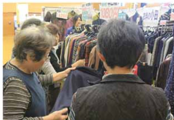
出張商店街で買い物を楽しむ来客者