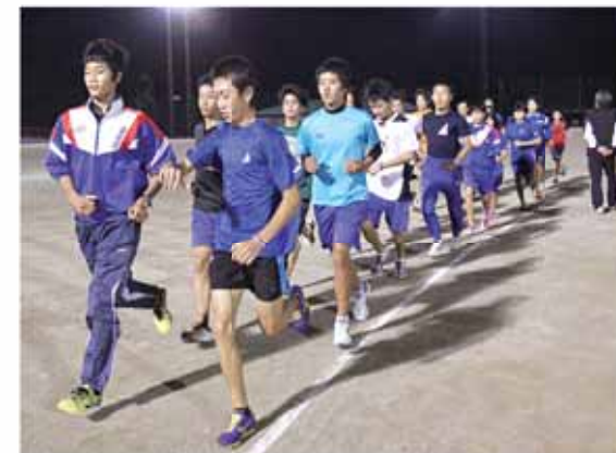
ぐりんばるで厳しい練習を重ねる選手たち