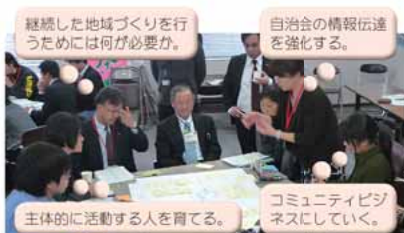
第3回会議では個別分野の進め方を議論

「NEXTまきのほら」の会議では、専門性が高いアドバイザーが参加して話し合いをサポートするとともに、議論の結果を行政と協議して整理し、次回会議の検討資料として返す方法でまとめていきました。また、将来都市像の検討では、泰原高校、相良高校、静岡産業大学の協力を得て学生の意見を確認するなど、必要に応じて外部の意見を参考としました。 こうして、全5回の会議を通じて、施策の優先順位、個別施策の進め方、将来都市像を議論し、「NEXTまきのほら」の計画案ができました。