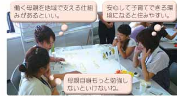
小さな子どもを持つ母親の話し合い

市民の皆さんが考える「住みたいまちの姿」を把握するため、市内173の団体や法人の皆さんとの意見交換会を開催しました。この会は、分野別の意見の違いを把握するため、健康福祉や産業、小さな子どもを持つ母親などの7つの分野別に17回開催し、513人が参加しました。 参加者は人口の推移などの統計データについて説明を受けた後、「住みたいまちの姿」、「その実現に向けてそれぞれができること」などのテーマについて、男女協働サロンの形で話し合いました。 出された全ての意見を多い順にする下記のとおりです。ただ分野別では職業や年齢、性別などの違いにより、意見の傾向が大きく異なりました。この結果を基に施策の方向性を検討することとしました。