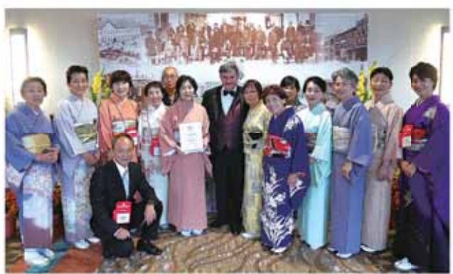
最高評価をみんなで喜ぶ