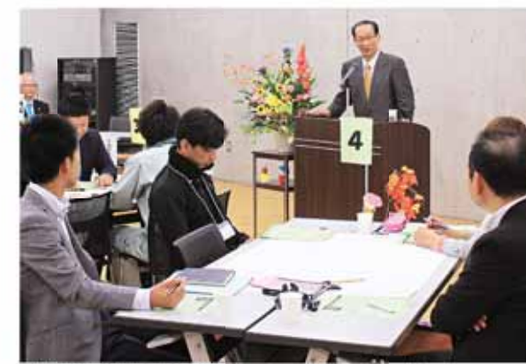
北川正恭教授による講演を聞く「茶々若会」メンバー