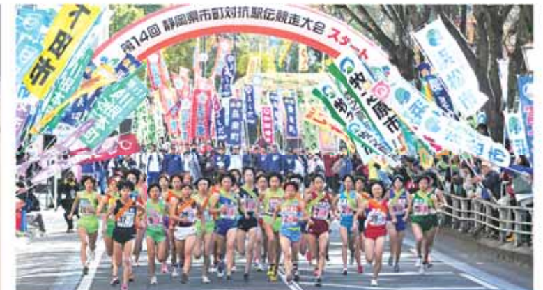
前回大会のスタートの様子