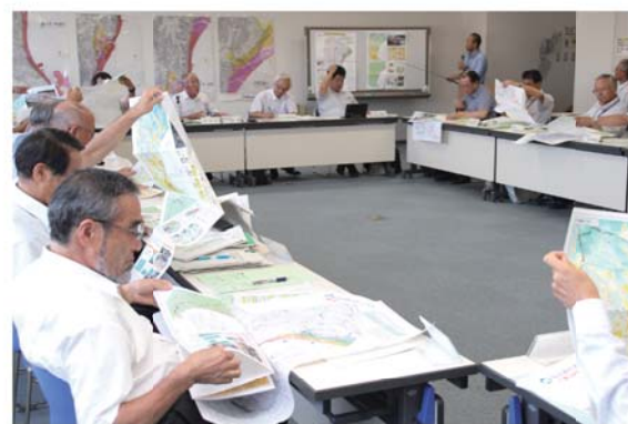
津波ハザードマップ案を確認する委員

8月6日から10日にかけて開かれた各地区の推進委員会説明会では、次のとおり、さまざまな意見や質問が出されました。