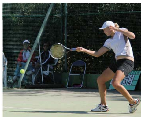
一球に思いを込めて振り抜く(2012大会の様子)

大会名称 G O S E N C U P スウィングビーチ牧之原国際女子オープンテニストーナメント 開催期間 「シングルス」▼予選 10月13日(日)〜14日(月)▼本戦 10月15日(火)〜20日(日) 「ダブルス」▼予選 10月14日(日)▼本戦 10月15日(火)〜19日(土) 会場 静波リゾートホテル・スウィングビーチ 試合種目 ▼シングルス 本戦32人(予選32人) ▼ダブルス 本戦16組(予選4組) 試合方法 3タイプブレイクセットマッチ(ダブルスファイナルはスーパータイブレーク) 入場料 無料 主催 牧之原国際女子オープンテニス実行委員会 会場問い合わせ 静波リゾートホテル・スウィングビーチ ☎(22) 1717 大会ホームページ http://www.2.tokai.or.jp/takase.tennis.d/gosencup.htm